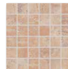
DDM06352 (SET) PEI 5 \odot 72 / set mat/lappato | matt/lappato růžová / rose / różowa розовый / rózsaszín / rosa