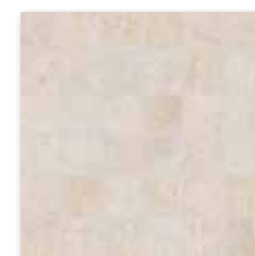
DDM06351 (SET) PEI 5 \odot 72 / set mat/lappato | matt/lappato běžová / beige / bežowa бежевый / bézs / beige