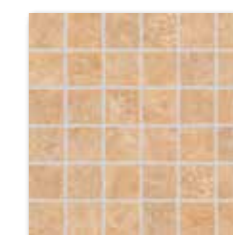
DDM06353 (SET) PEI 5 \odot 72 / set mat/lappato | matt/lappato hnědá / brown / brązowa коричневый / barna / marrón