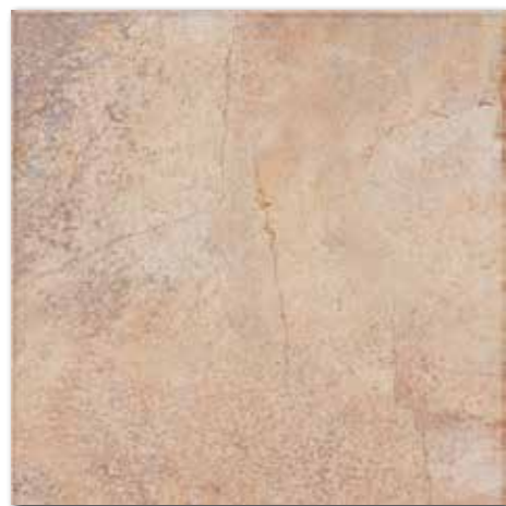
DAK63352 PEI 5 \odot 86 / m 2 mat | matt | R9 | A DAP63352 PEI 5 \odot 88 / m 2 lappato | lappato | R9