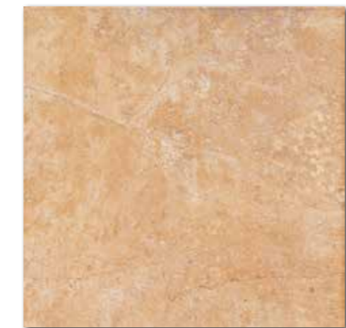
DAK63353 PEI 5 \odot 86 / m 2 mat | matt | R9 | A DAP63353 PEI 5 \odot 88 / m 2 lappato | lappato | R9