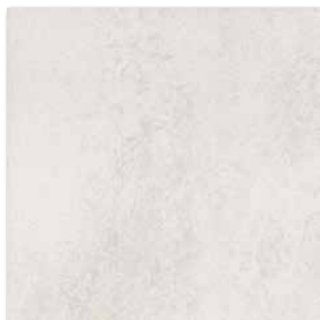
DAK63350 PEI 5 \odot 86 / m 2 mat | matt | R9 | A DAP63350 PEI 5 \odot 88 / m 2 lappato | lappato | R9