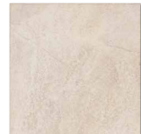
DAK63351 PEI 5 \odot 86 / m 2 mat | matt | R9 | A DAP63351 PEI 5 \odot 88 / m 2 lappato | lappato | R9