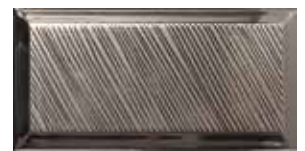
ARTS SILVERBRIGHT 219691 / ZP 502