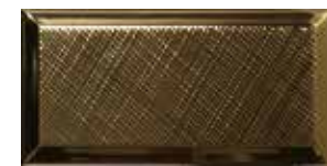
ARTS GOLDBRIGHT 219690 / ZP 502