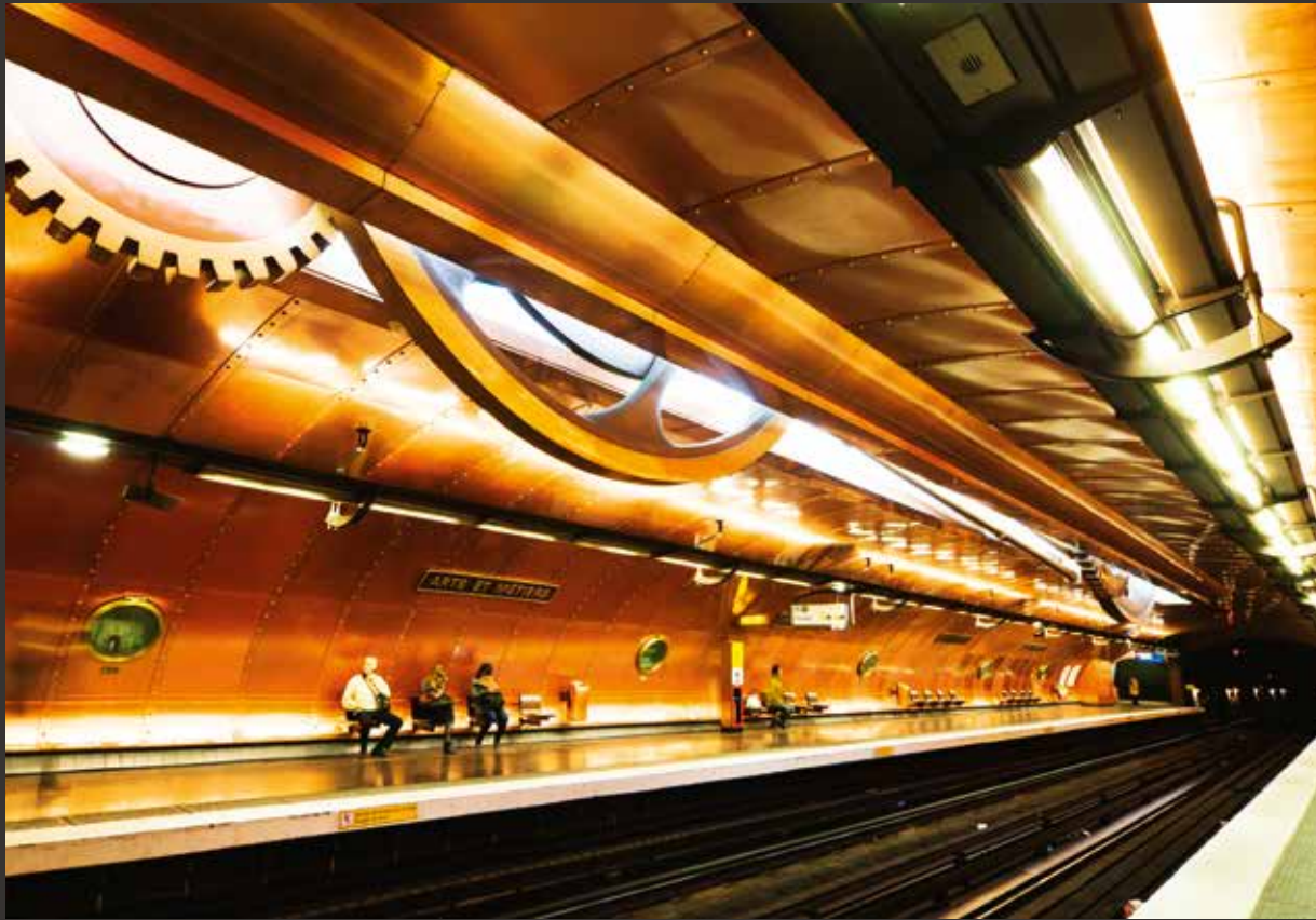
Arts et Métiers, Paris, France.