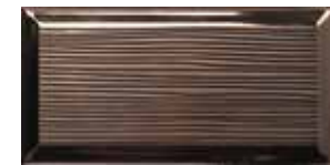
ARTS COPPERBRIGHT 219689 / ZP 502