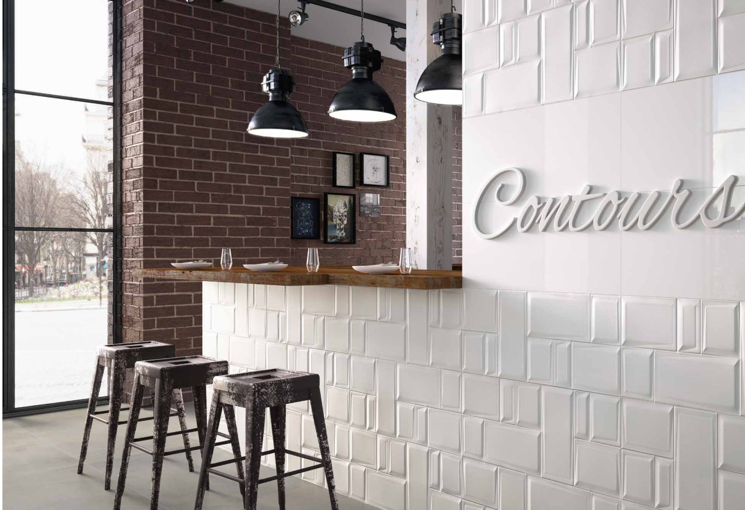
Carrés 32x75 mat, 32x75 Lisse poli