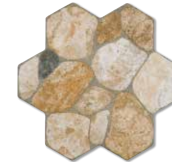
ANTARES S008 40x40 cm.