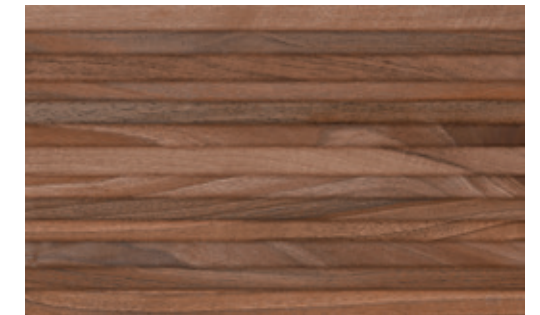
Deco Maison Nogal 40.8x66.2 / 8"x26"