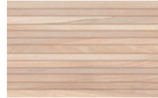
Deco Maison Haya 40.8x66.2 / 8"x26"