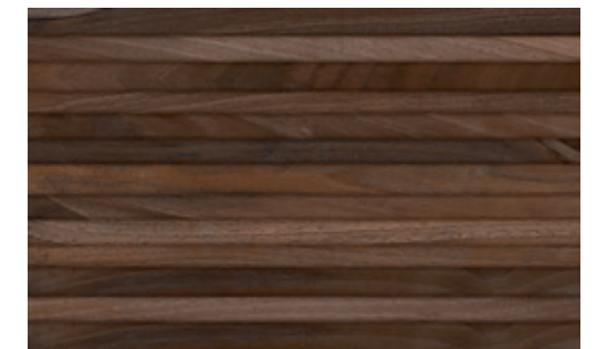
Deco Maison Olivo 40.8x66.2 / 8"x26"