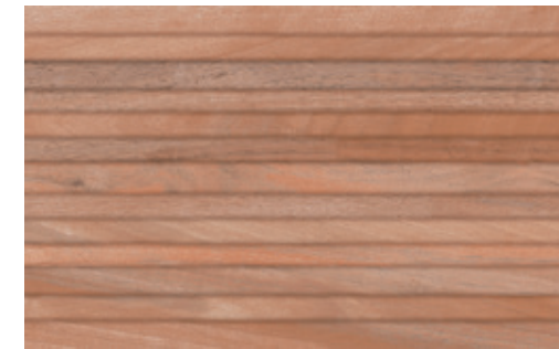
Deco Maison Cerezo 40.8x66.2 / 8"x26"