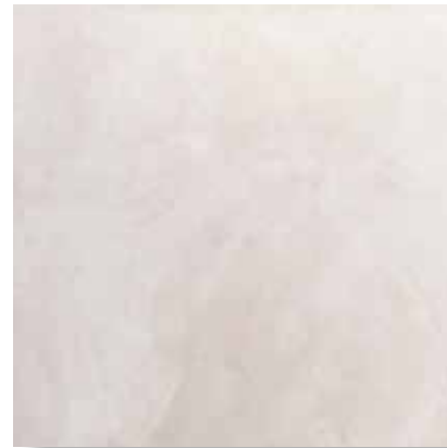
MICROCEMENTO BLANCO S-R 59,6x59,6x1,1cm P1856883 / 100137638 G354 Butech recomienda junta / Butech recommends joint: Colorstuk Rapid n Gris B22502013 / 100004305