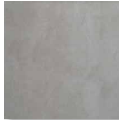
MICROCEMENTO GRIS S-R 80x80x1,2cm P1760073 / 100153456 G369 59,6x59,6x1,1cm P1856872 / 100137639 G354 Butech recomienda junta / Butech recommends joint: Colorstuk Rapid n Cemento B22502004 / 100004297