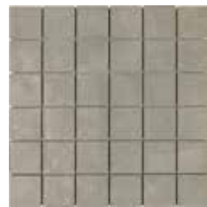
MOSAICO EVO GREY 30X30/11,8"x11,8"