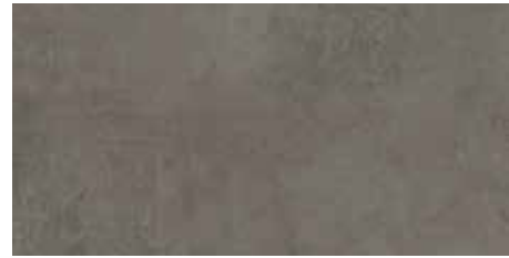
EVO GRAPHITE 30X60/11,8"x23,6"