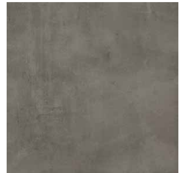
EVO GRAPHITE 75X75/29,5"x29,5"