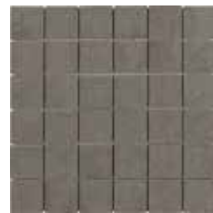
MOSAICO EVO GRAPHITE 30X30/11,8"x11,8"