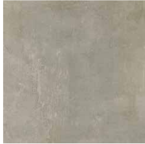
HULK GREY 60,3X60,3/23,7"X23,7"