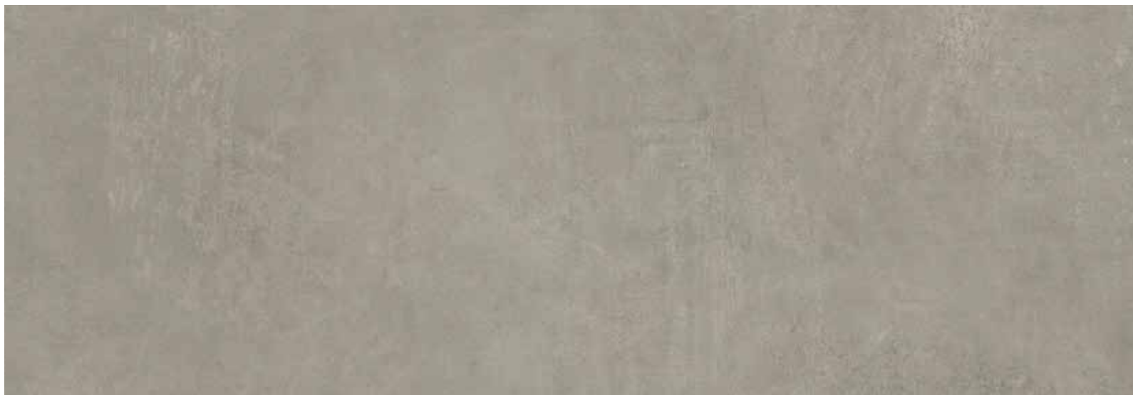
CASSIUS GREY 100X300X0,35/39,4"x118,1"x0,14"

GROUP Bla-UGL (Deep abrasion resistance \leq 146\text{mm}^3 )