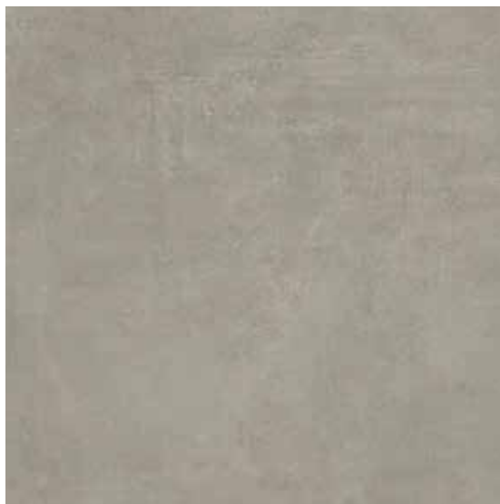
CASSIUS GREY 100X100X0,35/39,4"x39,4"x0,14"