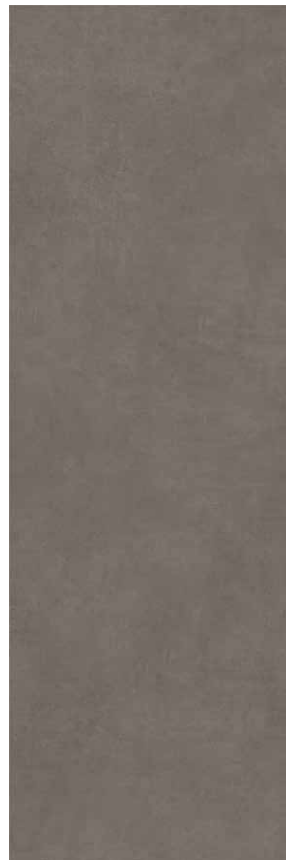
CASSIUS GRAPHITE 100X300X0,35/39,4"x118,1"x0,14" F04/M

100X300 / 39,4"x118,1" 0,35 ESPESOR / 0,14" thickness