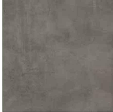
HULK GRAPHITE 60,3X60,3/23,7"X23,7"