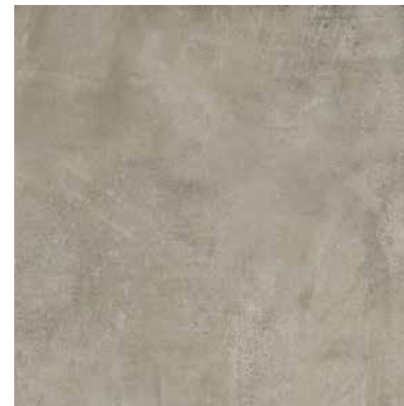
EVO GREY 75X75/29,5"x29,5"