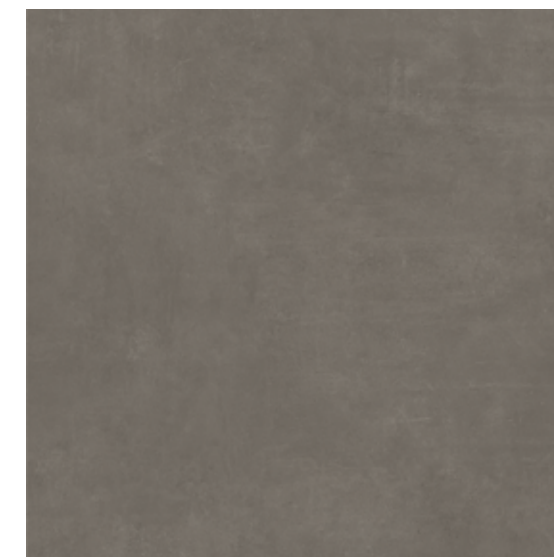
CASSIUS GRAPHITE 100X100X0,35/39,4"x39,4"x0,14"

GROUP Bla-UGL (Deep abrasion resistance \leq 146\text{mm}^3 )