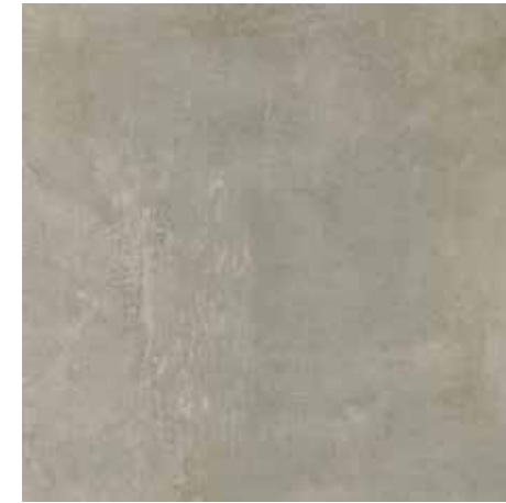
EVO GREY 60X60/23,6"x23,6"