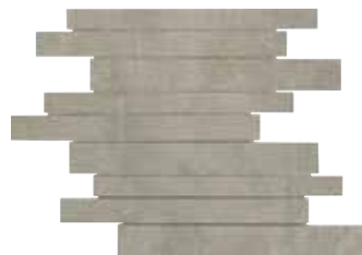
MURETO EVO GREY 30X43/11,8"x16,9"