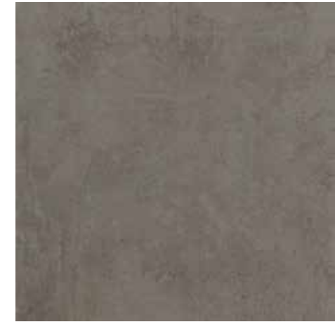
EVO GRAPHITE 60X60/23,6"x23,6"