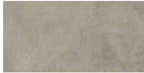
EVO GREY 30X60/11,8"x23,6"

GROUP Bla-UGL (Deep abrasion resistance \leq 145\text{mm}^3 )