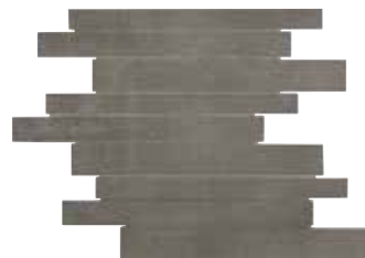
MURETO EVO GRAPHITE 30X43/11,8"x16,9"