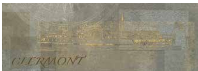
DECOR SYNCRO GRIS 02 30x85 29x84 REC. LAP.