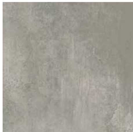
SYNCRO GRIS 60x60 59x59 REC. LAP.