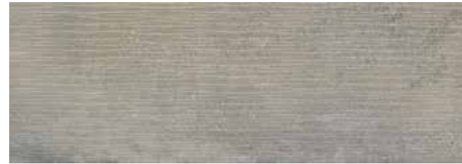
SYNCRO GRIS REL. 30x85 29x84 REL. LAP.