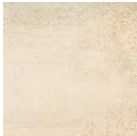
SYNCRO CREMA 60x60 59x59 REC. LAP.