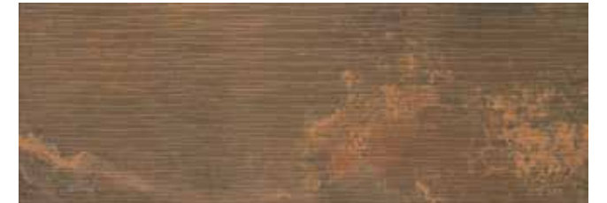
SYNCRO ÓXIDO REL. 30x85 29x84 REL. LAP.