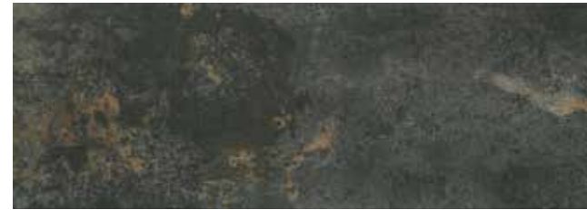
SYNCRO ACERO 30x85 29x84 LAP.