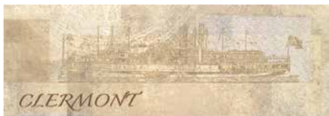
DECOR SYNCRO CREMA 02 30x85 29x84 REC. LAP.