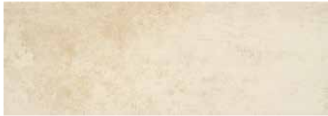
SYNCRO CREMA 30x85 29x84 LAP.

60X60 • 59X59 REC. LAP. • 30X85 • 29X84 REC. LAP. • 45X45