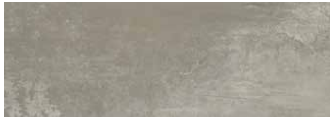
SYNCRO GRIS 30x85 29x84 LAP.

60X60 • 59X59 REC. LAP. • 30X85 • 29X84 REC. LAP. • 45X45