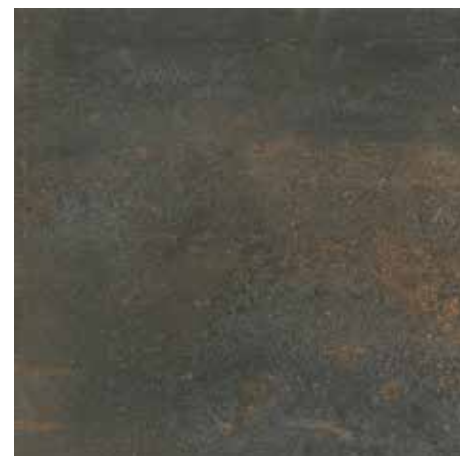
SYNCRO ACERO 60x60 59x59 REC. LAP.