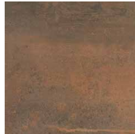
SYNCRO ÓXIDO 60x60 59x59 REC. LAP.