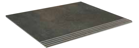
PELDAÑO SYNCRO ACERO* 30x60 29x59 REC. LAP. 30x85 29x84 REC. LAP.