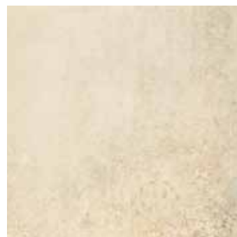
SYNCRO CREMA 45x45