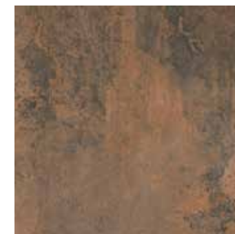
SYNCRO ÓXIDO 45x45