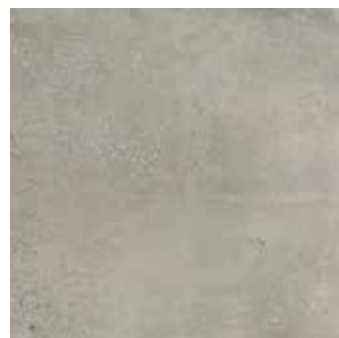
SYNCRO GRIS 45x45