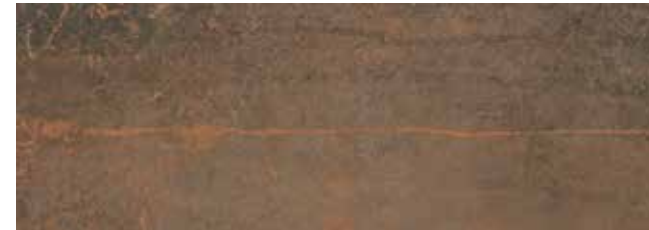
SYNCRO ÓXIDO 30x85 29x84 LAP.