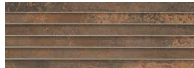
VENECIANA SYNCRO ÓXIDO 29x84 REC. LAP.