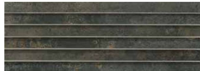
VENECIANA SYNCRO ACERO 29x84 REC. LAP.