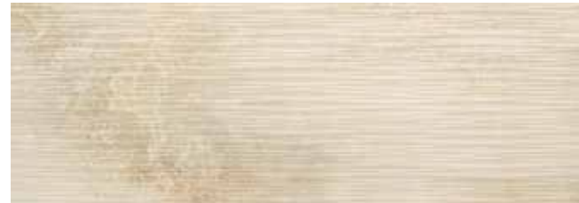
SYNCRO CREMA REL. 30x85 29x84 REL. LAP.