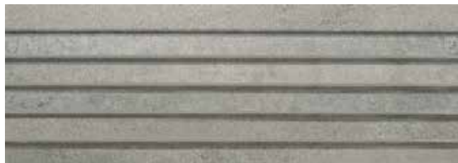
VENECIANA SYNCRO GRIS 29x84 REC. LAP.