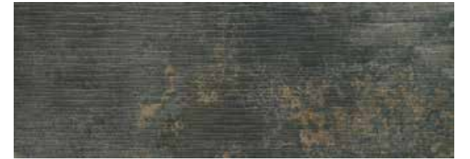
SYNCRO ACERO REL. 30x85 29x84 REL. LAP.