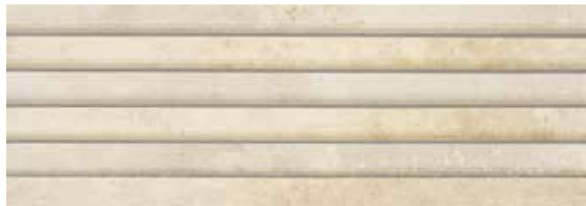
VENECIANA SYNCRO CREMA 29x84 REC. LAP.