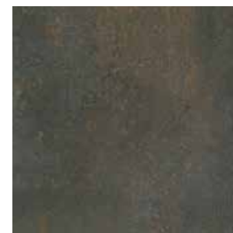
SYNCRO ACERO 45x45