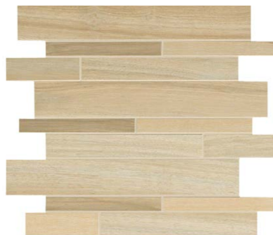
* MOSAICO LISTELLATO 30x30 - 12"x12" G92015 MIELE 16 G92016 NOCE 16 G92017 MOKA 16 G92018 BIANCO 16 G92019 CENERE 16 G30475 NERO 16