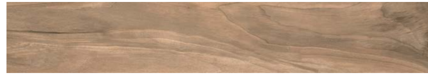
G3007A NOCE 15x90 - 5,9"x35,5"