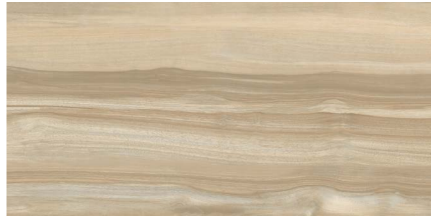
G3026A MIELE 45x90 - 17,7"x35,5"