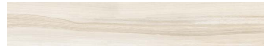
G3005A BIANCO 15x90 - 5,9"x35,5"