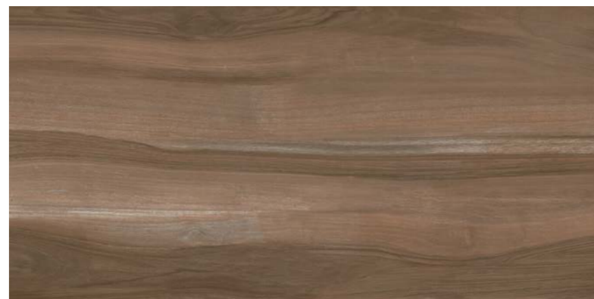
G3018A MOKA 45x90 - 17,7"x35,5"