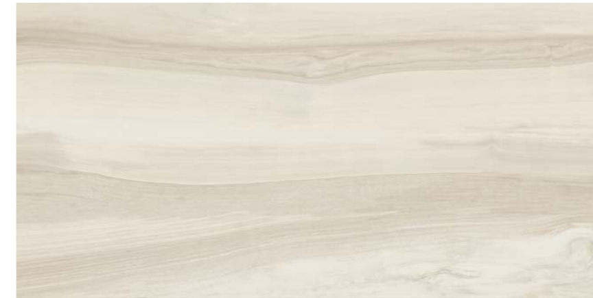
G3016A BIANCO 45x90 - 17,7"x35,5"