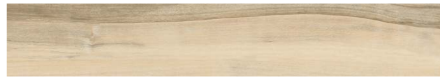
G3006A MIELE 15x90 - 5,9"x35,5"