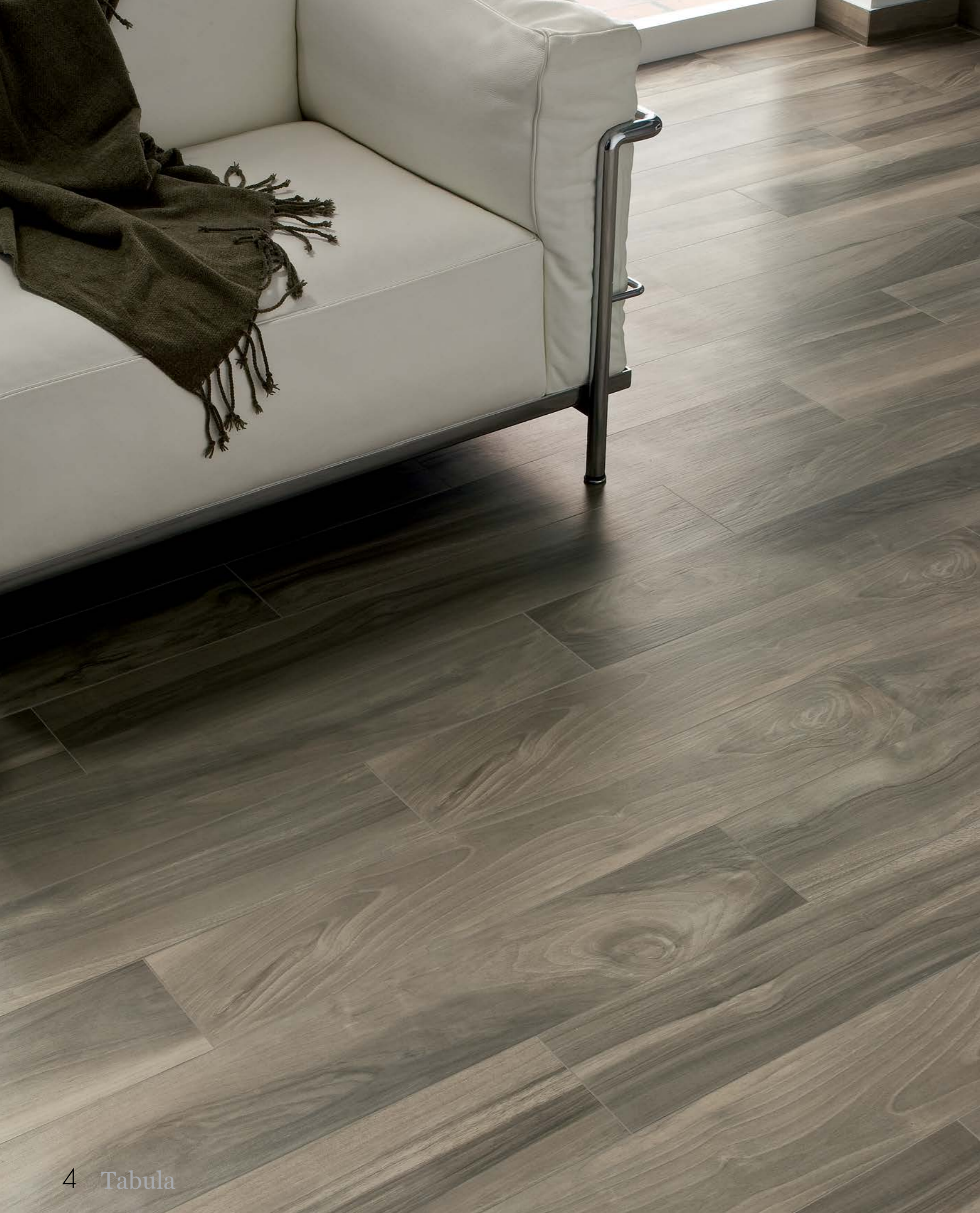
Tabula Cenere 15x90