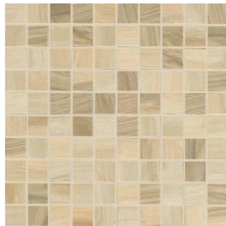
* MOSAICO 30x30 - 12"x12" TESSERE 3x3 - 1,2"x1,2" G91003 MIELE 16 G91004 NOCE 16 G91005 MOKA 16 G91006 BIANCO 16 G91007 CENERE 16 G30468 NERO 16