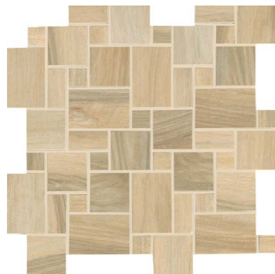
* MOSAICO MODULAR 30x30 - 12"x12" G92010 MIELE 21 G92011 NOCE 21 G92012 MOKA 21 G92013 BIANCO 21 G92014 CENERE 21 G30470 NERO 21