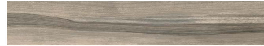
G3009A CENERE 15x90 - 5,9"x35,5"