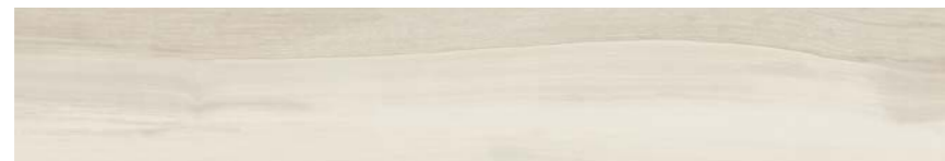
G3001A BIANCO GRIP 15x90 - 5,9"x35,5"