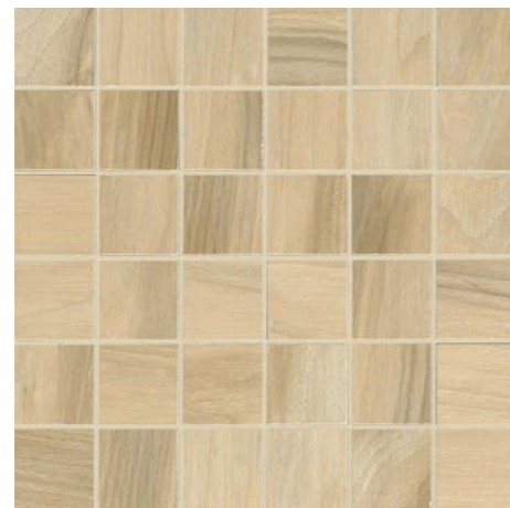
* MOSAICO 30x30 - 12"x12" TESSERE 5x5 - 2"x2" G91008 MIELE 12 G91009 NOCE 12 G91010 MOKA 12 G91011 BIANCO 12 G91000 CENERE 12 G30467 NERO 12