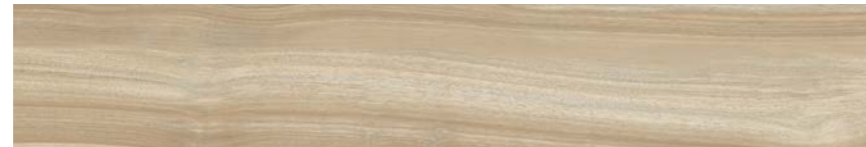
G3003A MIELE GRIP 15x90 - 5,9"x35,5"