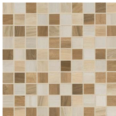
G91002 MOSAICO MIX CALDO 30x30 - 12"x12" TESSERE 3x3 - 1,2"x1,2" 17

* Disponibile in tutti i colori Available in all colors В наличии все цвета