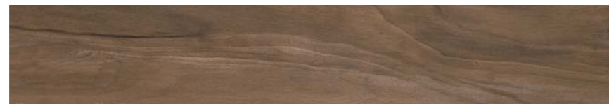
G3015A MOKA 15x90 - 5,9"x35,5"