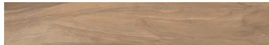
G3005A NOCE GRIP 15x90 - 5,9"x35,5"