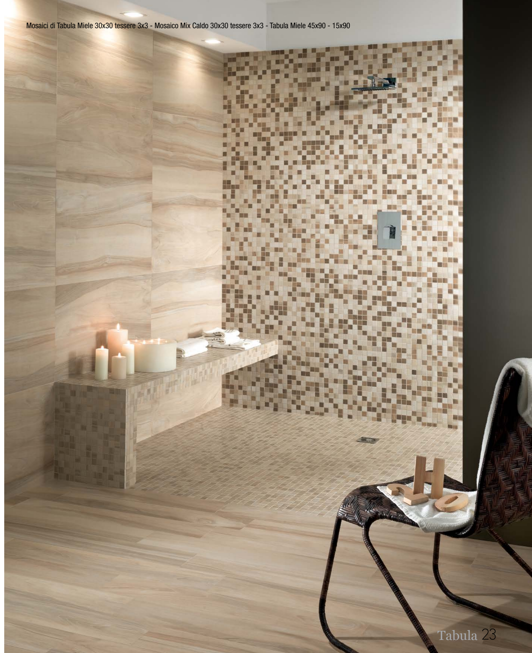
Mosaici di Tabula Miele 30x30 tessere 3x3 - Mosaico Mix Caldo 30x30 tessere 3x3 - Tabula Miele 45x90 - 15x90

* Disponibile in tutti i colori Available in all colors В наличии все цвета