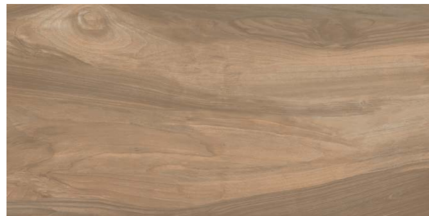
G3019A NOCE 45x90 - 17,7"x35,5"