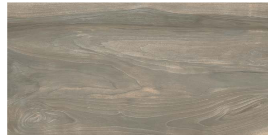
G3017A CENERE 45x90 - 17,7"x35,5"