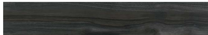
G1273A NERO GRIP 15x90 - 5,9"x35,5"