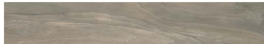
G3002A CENERE GRIP 15x90 - 5,9"x35,5"