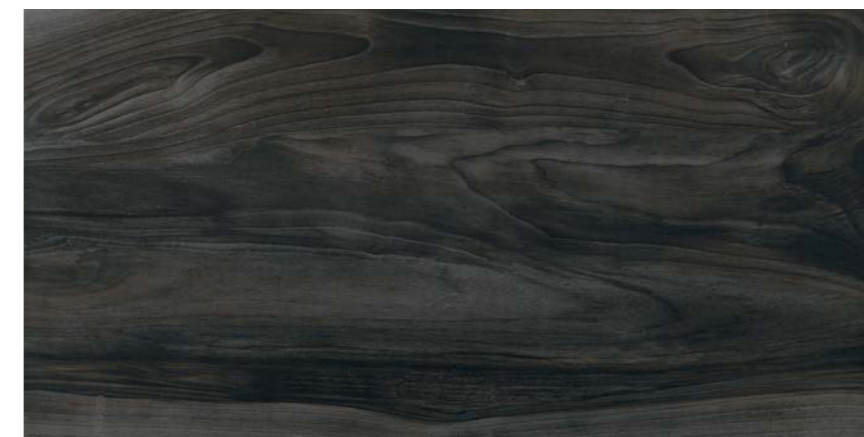
G1272A NERO 45x90 - 17,7"x35,5"