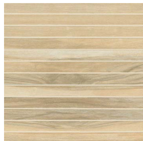
* MOSAICO REGOLARE 30x30 - 12"x12" 2,5x30 - 1"x12" G92005 MIELE 12 G92006 NOCE 12 G92007 MOKA 12 G92008 BIANCO 12 G92009 CENERE 12 G30469 NERO 12