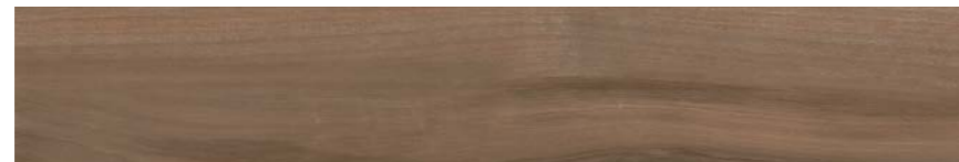
G3004A MOKA GRIP 15x90 - 5,9"x35,5"