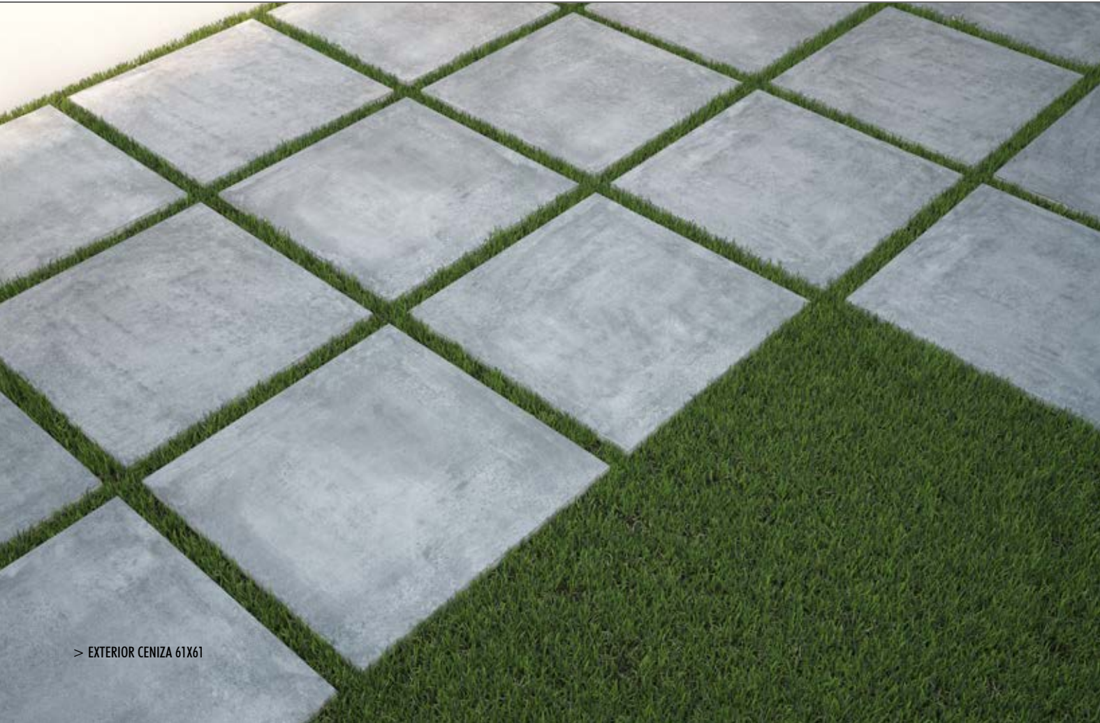
> EXTERIOR CENIZA 61X61

Pavimento con las mismas atribuciones que las correspondientes al tipo D, pero además especialmente indicado para usos donde se requiera una elevada carga de rotura.