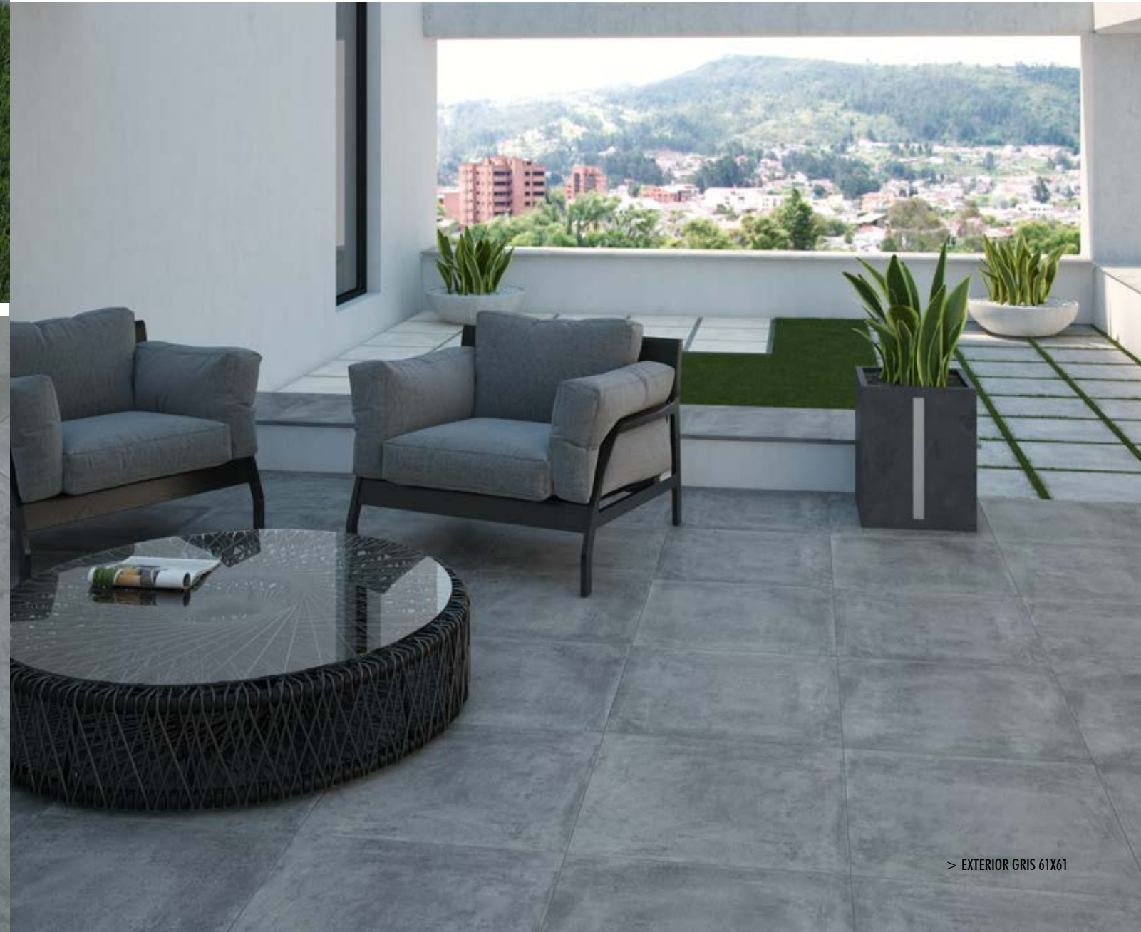
> EXTERIOR GRIS 61X61