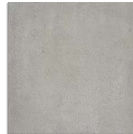
BMH713 Exterior 61x61 Ceniza Antideslizante