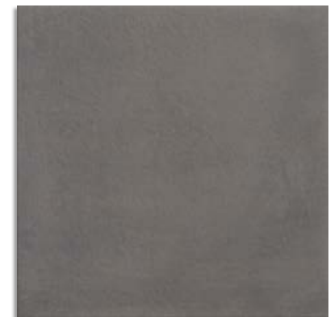
BMH710 Exterior 61x61 Gris Antideslizante