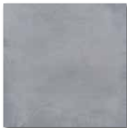
DAA3B211 PEI 4 ○ 74 / m 2 mat | matt