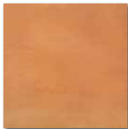
DAA3B215 PEI 4 ○ 74 / m 2 mat | matt