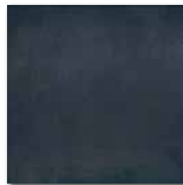
DAA3B213 PEI 4 ○ 74 / m 2 mat | matt