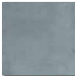
DAA3B212 PEI 4 ○ 74 / m 2 mat | matt