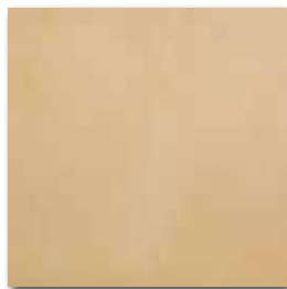
DAA3B214 PEI 4 ○ 74 / m 2 mat | matt