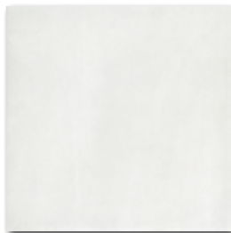
DAA3B210 PEI 4 ○ 74 / m 2 mat | matt