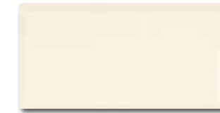
WADMB124 82 / m 2 lesk | glossy