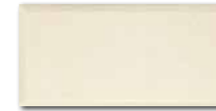
WADMB224 82 / m 2 lesk | glossy | V2