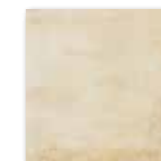
DAR2W663 Siena PEI 5 82 / m 2 mat | matt