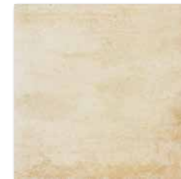
DAR44663 Siena PEI 5 78 / m 2 mat | matt

světle béžová / light beige / jasnobeżowa / светло-бежевый világosbézs / beige claro