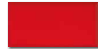
WADMB125 82 / m 2 lesk | glossy