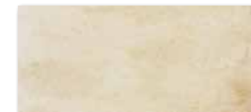
DARPP663 Siena PEI 5 82 / m 2 mat | matt

světle béžová / light beige / jasnobeżowa / светло-бежевый világosbézs / beige claro