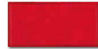
WADMB225 82 / m 2 lesk | glossy | V2