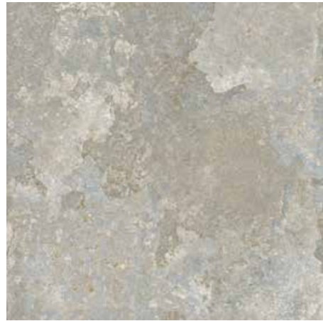
Grey 60x60/24"x24" R ML41 30x60/12"x24" R ML52