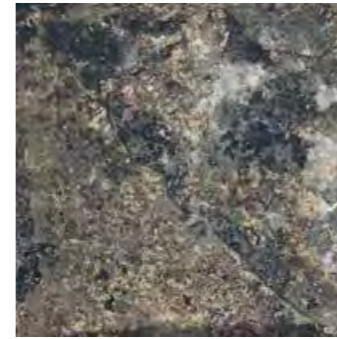
Dark 30x30/12"x12" R MM10