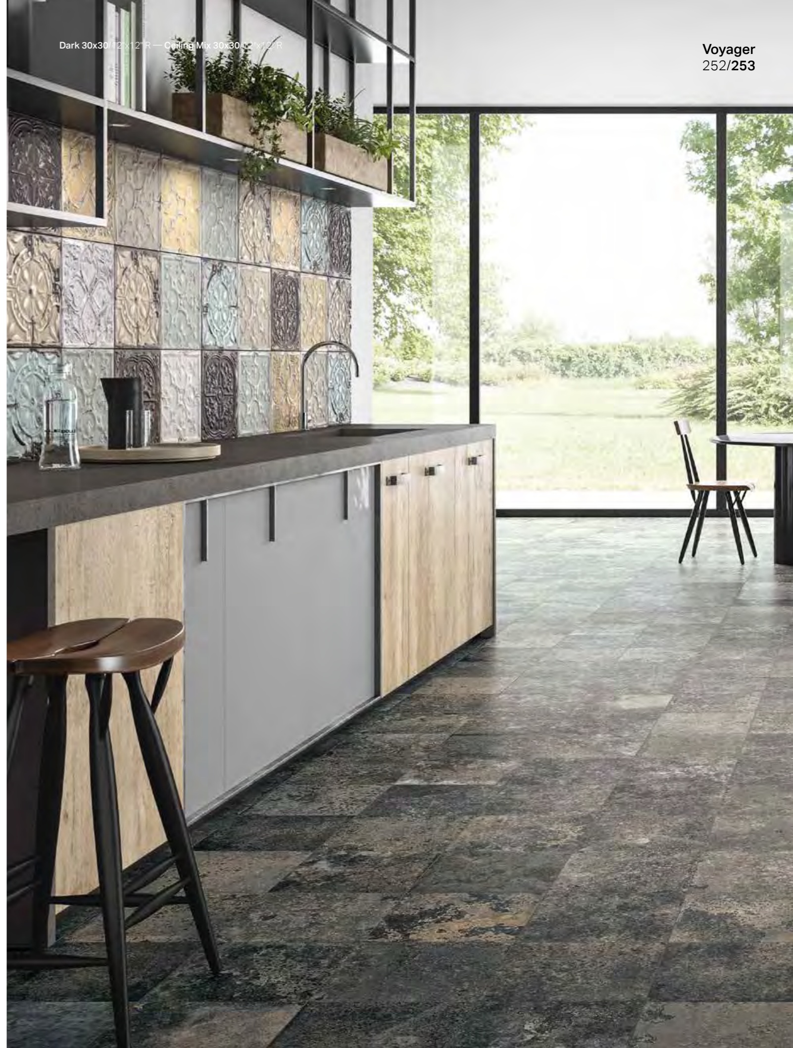
Dark 30x30/12"x12" R — Ceiling Mix 30x30/12"x12" R

4 soggetti diversi formato 30x30 (miscelazione casuale)/ 4 assorted motifs 30x30 size (random mix)/ 4 sujets differents format 30x30 (melange aleatoire)/ 4 verschiedene Motive Format 30x30 (Zufallsmischung)/ 4 verschillende ontwerpen in 30x30 (willekeurig gemengd)/ 4 motivos diferentes formato 30x30 (mezcla casual)