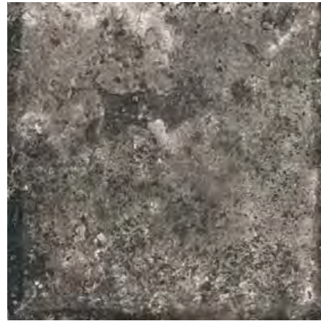
Dark 60x60/24"x24" R ML40 30x60/12"x24" R ML51