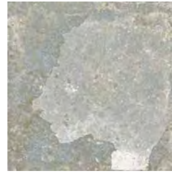
Grey 30x30/12"x12" R MM11