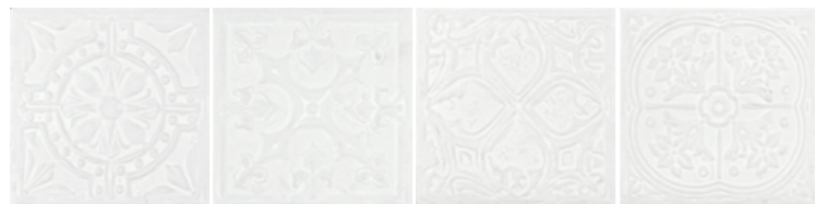
Ceiling 30x30/12"x12" R MM05 White

15 soggetti diversi formato 30x30 (miscelazione casuale)/ 15 assorted motifs 30x30 size (random mix)/ 15 sujets differents format 30x30 (melange aleatoire)/ 15 verschiedene Motive Format 30x30 (Zufallsmischung)/ 15 verschillende ontwerpen in 30x30 (willekeurig gemengd)/ 15 motivos diferentes formato 30x30 (mezcla casual)