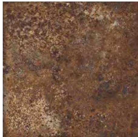
Rust 60x60/24"x24" R ML43 30x60/12"x24" R ML54