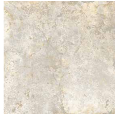
Light 60x60/24"x24" R ML42 30x60/12"x24" R ML53