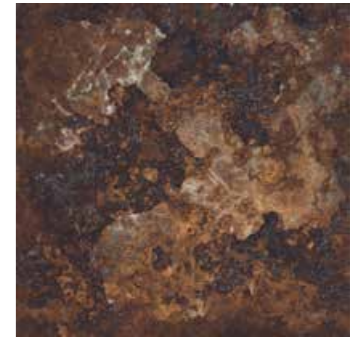
Rust 30x30/12"x12" R MM13