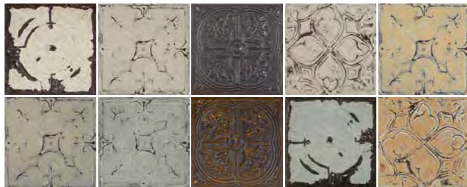
Ceiling 30x30/12"x12" R MM04 Mix

15 soggetti diversi formato 30x30 (miscelazione casuale)/ 15 assorted motifs 30x30 size (random mix)/ 15 sujets differents format 30x30 (melange aleatoire)/ 15 verschiedene Motive Format 30x30 (Zufallsmischung)/ 15 verschillende ontwerpen in 30x30 (willekeurig gemengd)/ 15 motivos diferentes formato 30x30 (mezcla casual)