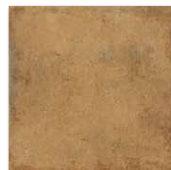
DAR44664 PEI 4 ○ 78 / m 2 mat | matt