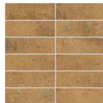
DDP44664 PEI 4 ○ 72 / set mat | matt