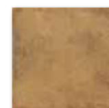
DAR2W664 PEI 4 ○ 82 / m 2 mat | matt