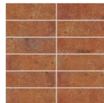
DDP44665 PEI 4 ○ 72 / set mat | matt