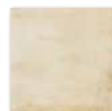
DAR2W663 PEI 5 ○ 82 / m 2 mat | matt