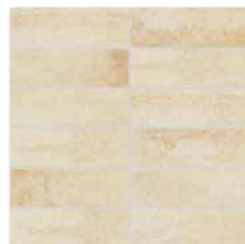
DDP44663 PEI 5 ○ 72 / set mat | matt