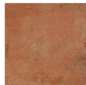
DAR44665 PEI 4 ○ 78 / m 2 mat | matt