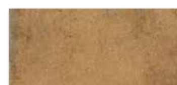
DARPP664 PEI 4 ○ 82 / m 2 mat | matt