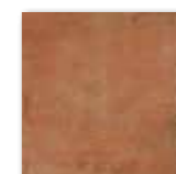
DAR2W665 PEI 4 ○ 82 / m 2 mat | matt