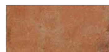
DARPP665 PEI 4 ○ 82 / m 2 mat | matt