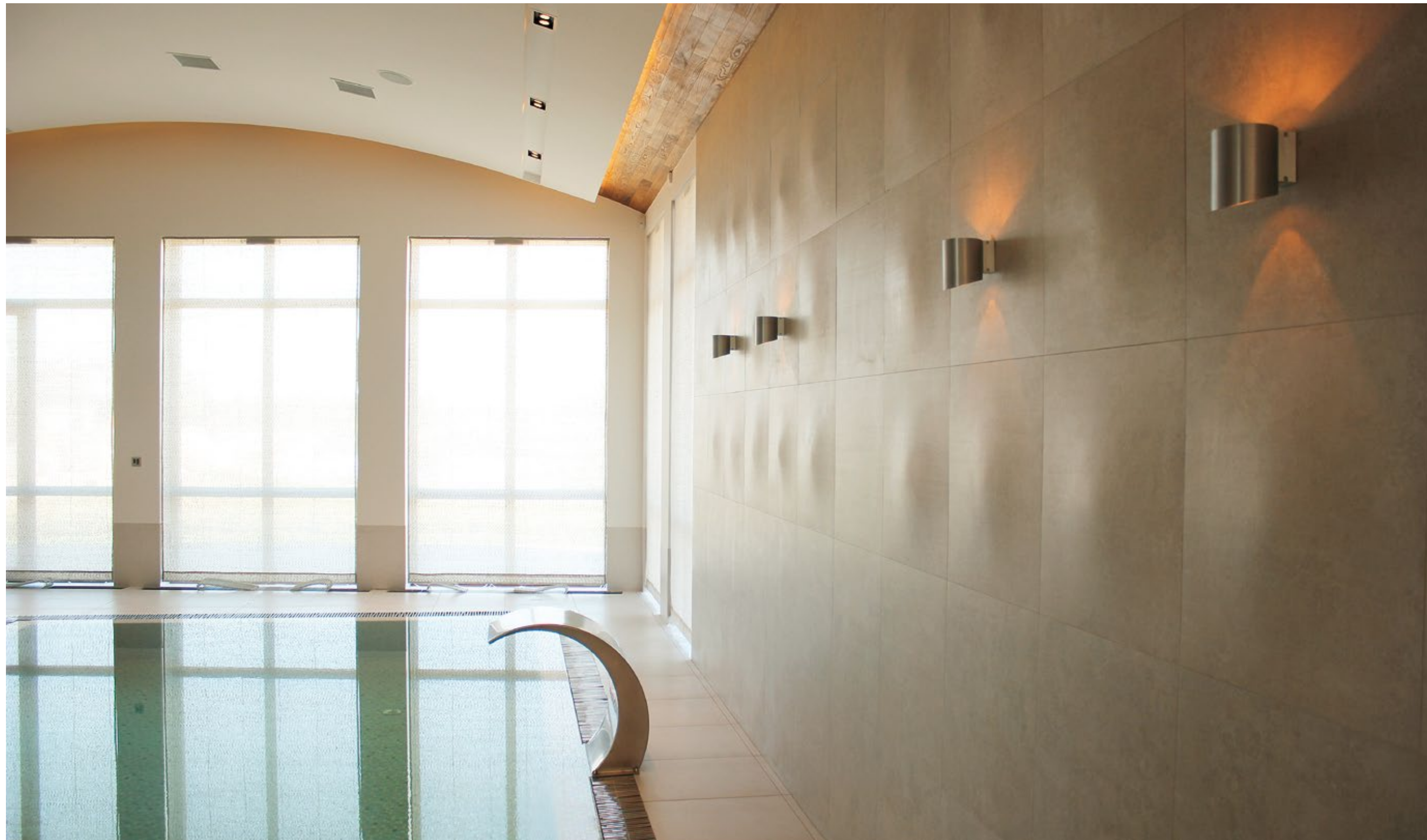
product: evolution beige striato bump 60x60 and evolution beige striato 60x60

* FOR ARCH CONCEPT WE RECOMMEND 3 MM JOINT. PARA ARCH CONCEPT SE RECOMIENDA UNA JUNTA DE COLOCACIÓN DE 3 MM. * WE RECOMMEND USING MECHANICAL ANCHORING FOR INSTALLATION. SEE PAGE 40. PARA LA COLOCACIÓN DE ESTAS PIEZAS SE RECOMIENDA EL USO DE ANCLAJES MECÁNICOS. VER PAGINA 40.