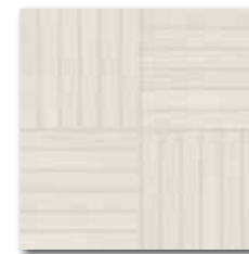
DDV1V618 (SET) PEI 5 ○ 72 / set mat | matt