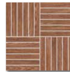
DDV1V620 (SET) PEI 4 ○ 72 / set mat | matt