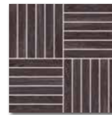
DDV1V621 (SET) PEI 4 ○ 72 / set mat | matt