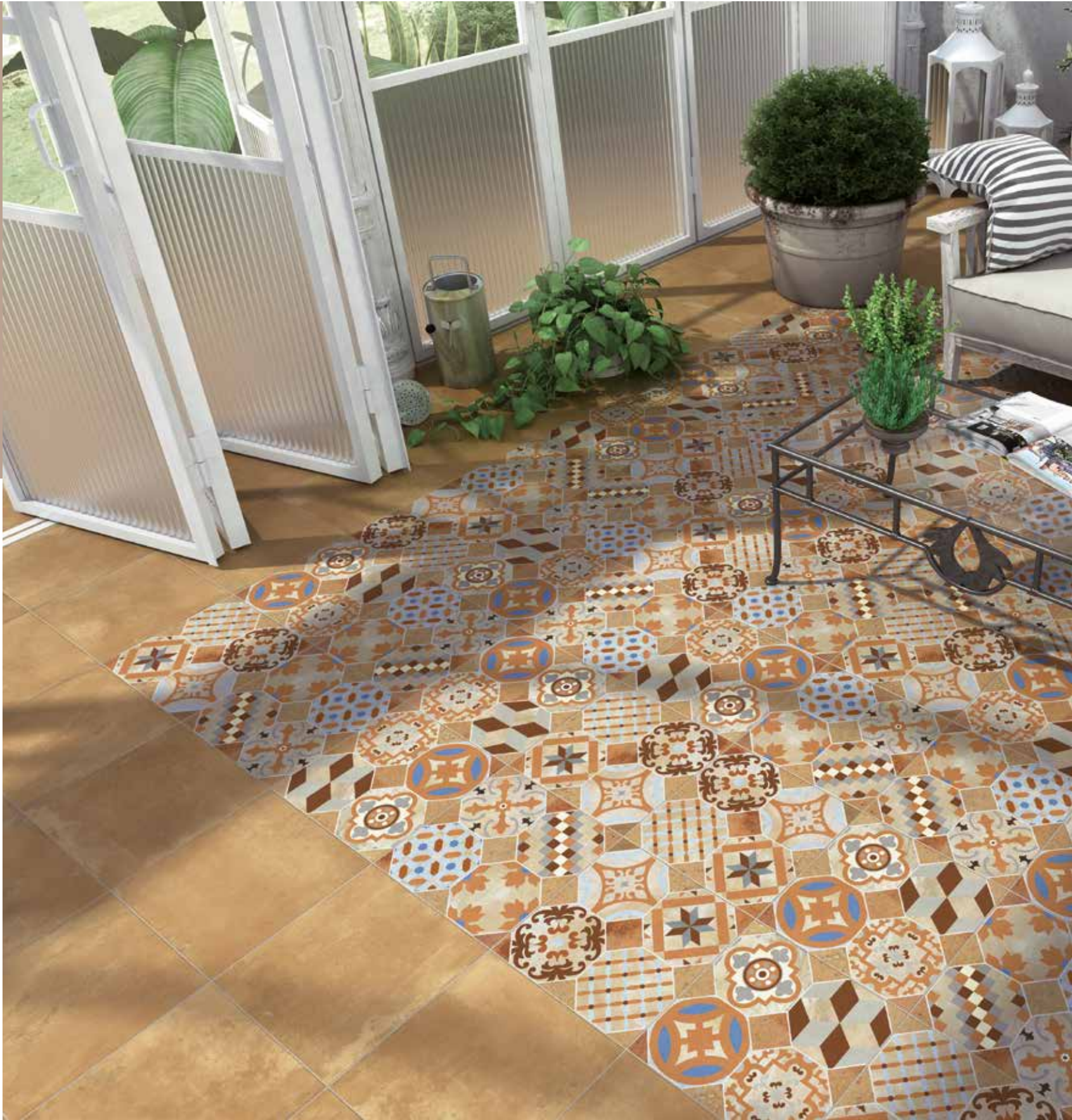
PAVIMENTO: GIBRALTAR HEXÁGONO MIX 34x34 cm. GIBRALTAR ARENA 34x34 cm.