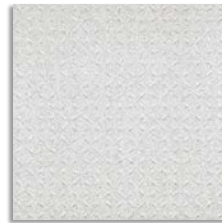
Abeto R-22 G.120