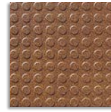
Arce R-14 G.120