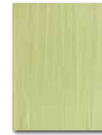
WARKB018 ○ 64 / m 2 mat | matt