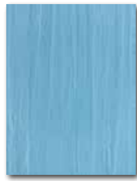
WARKB019 ○ 64 / m 2 mat | matt