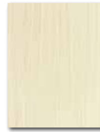
WARKB016 ○ 64 / m 2 mat | matt