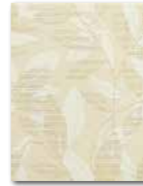
WITKB091 ○ 58 / ks mat | matt