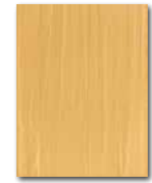
WARKB017 ○ 64 / m 2 mat | matt