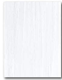
WARKB015 ○ 64 / m 2 mat | matt