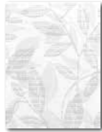
WITKB090 ○ 58 / ks mat | matt