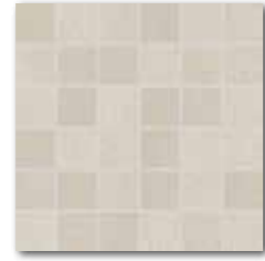
DDM06610 (SET) Unistone PEI 5 72 / set mat | matt