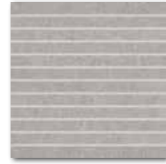
DDP34634 (SET) Rock PEI 5 72 / set mat | matt

běžová / beige / beżowa / бежевый / бэзс / beige