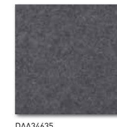
DAA34635 Rock PEI 5 72 / m 2 mat | matt

tmavě šedá / dark grey / ciemnoszara темно-серый / sötétszürke / gris oscuro