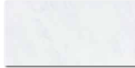
WADV4051 78 / m 2 lesk | glossy