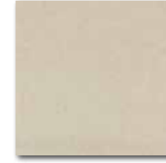
DAA34633 Rock PEI 5 72 / m 2 mat | matt

slonová kost / ivory / kość stoniowa слоновая кость / elefántcsont / marfil