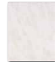
WATG6023 59 / m 2 lesk | glossy

běžová / beige / beżowa бежевый / бэзс / beige