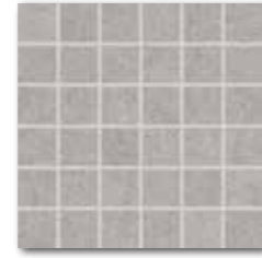
DDM06634 (SET) Rock PEI 5 72 / set mat | matt