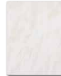
WATKB099 64 / m 2 lesk | glossy

šedá / grey / szara / серый szürke / gris