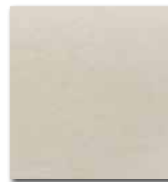
DAA3B610 Unistone PEI 5 74 / m 2 mat | matt

bílá / white / biata / белый fehér / blanco