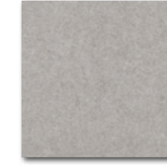
DAA34634 Rock PEI 5 72 / m 2 mat | matt

bílá / white / biata / белый fehér / blanco