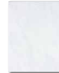
WATKB098 64 / m 2 lesk | glossy