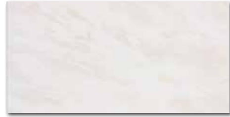
WADV4050 78 / m 2 lesk | glossy