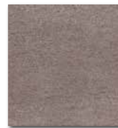
DAA3B612 Unistone PEI 5 74 / m 2 mat | matt

běžová / beige / beżowa / бежевый bézs / beige