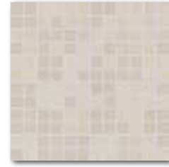
DDM0U610 (SET) Unistone PEI 5 82 / set mat | matt