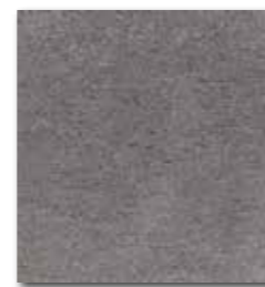
DAA3B611 Unistone PEI 5 74 / m 2 mat | matt

šedohnědá / grey-brown / szarobrazowa sero-korичневый / barna-szürke gris-marrón