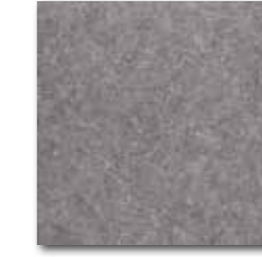
DAA34636 Rock PEI 5 72 / m 2 mat | matt

světle šedá / light grey / jasnoszara светло-серый / világosszürke / gris claro