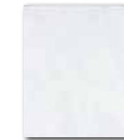
WATG6022 59 / m 2 lesk | glossy

šedá / grey / szara / серый szürke / gris