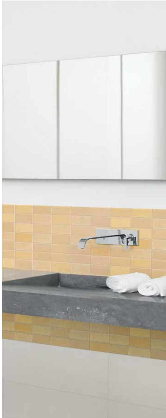
WALL_ EB48857 Bianco 20x60 - 7 7/8 x23 5/8 " EB49377 Senape mosaico Precious 20x60 - 7 7/8 x23 5/8 "