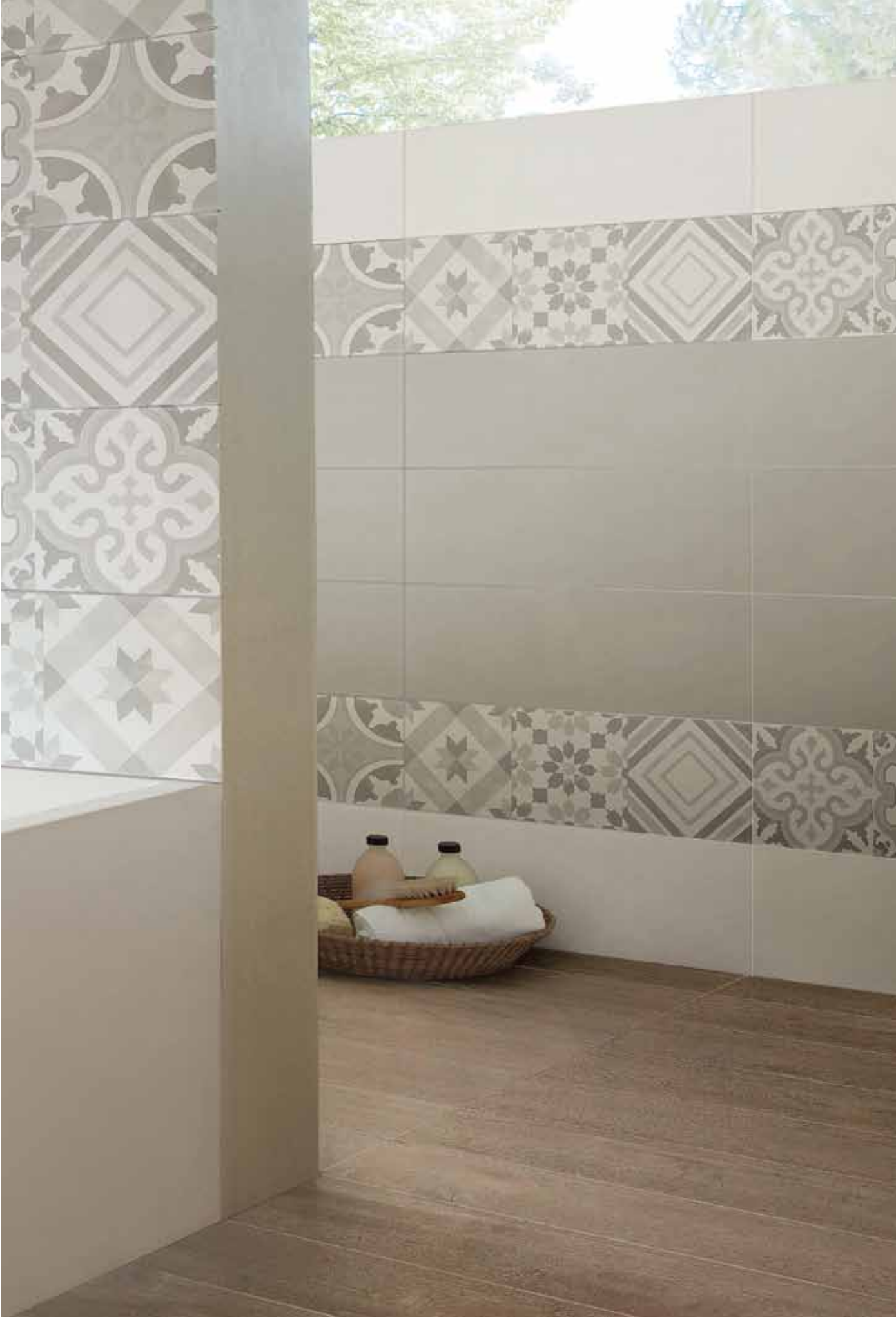
FLOOR_ SP49084 Cottage BG119 20x120 - 7 7/8 x 23 5/8 '' naturale rettificata WALL_ EB48857 Bianco 20x60 - 7 7/8 x 23 5/8 '' EB48859 Tortora 20x60 - 7 7/8 x 23 5/8 '' EB48899 Tortora decoro Cementine A-B 20x60 - 7 7/8 x 23 5/8 ''