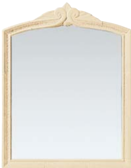
> composizione specchio lobato vertice pz. 1 + 2 angoli specchio 7x6 + 2 raccordi + 9 pz. bordo lobato specchio 94 x 115 cm - 37" x 45" 1/4 3MD**SL