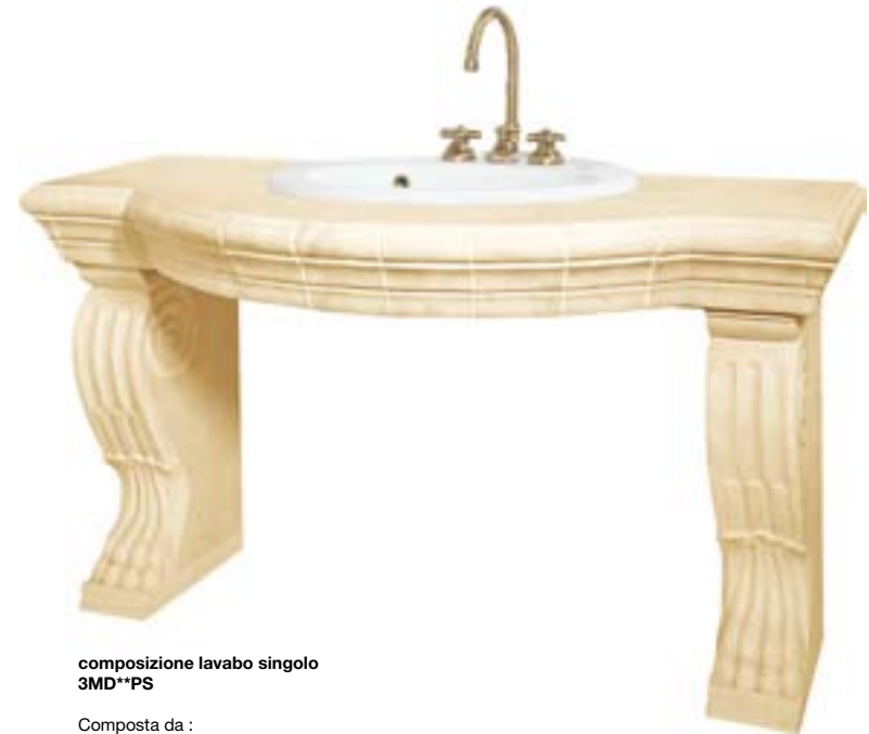
composizione lavabo singolo 3MD**PS

Composta da : Zampe di Leone Ridotte 15x33x47 pz. 2 Bordo Bombato 6,5x30,5 pz. 5 Spigolo Bombato 6,5x6,5 pz. 2