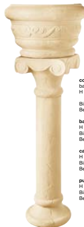
colonna consolle composta da: base con fusto, capitello e pulvino H 84,5 cm - 33" 1/4