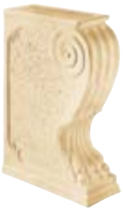
zampa di leone ridotta 15 x 33 x 47 cm - 5 7/8 x 13" x 18" 3MD**ZR

Composta da : Cimasa 15x30,5 pz. 4 Cimasa spigolo 6x15 pz. 2 Cimasa Angolare dx pz. 1 Cimasa Ang. sx pz. 1 Cimasa Ridotta 15x12 pz. 7 Zampa di Leone 15x36x68 pz. 2