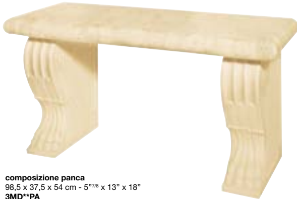
composizione panca 98,5 x 37,5 x 54 cm - 5 7/8 x 13" x 18" 3MD**PA

Composta da : Zampe di Leone Ridotte 15x33x47 pz. 2 Bordo Bombato 6,5x30,5 pz. 5 Spigolo Bombato 6,5x6,5 pz. 2