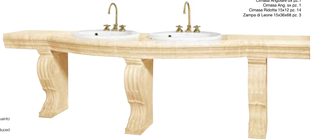
composizione lavabo doppio 3MD**PL

Composta da : Cimasa 15x30,5 pz. 6 Cimasa spigolo 6x15 pz. 2 Cimasa Angolare dx pz. 1 Cimasa Ang. sx pz. 1 Cimasa Ridotta 15x12 pz. 14 Zampa di Leone 15x36x68 pz. 3