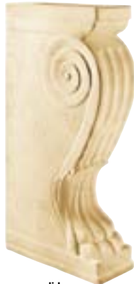
zampa di leone 15 x 36 x 68 cm - 5 7/8 x 14" x 27" 3MD**ZL