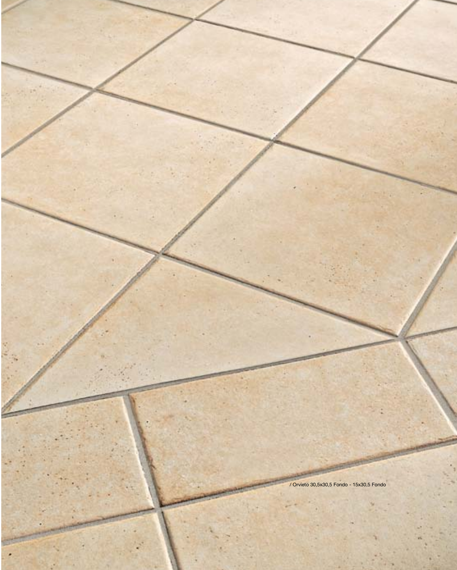
/ Orvieto 30,5x30,5 Fondo - 15x30,5 Fondo