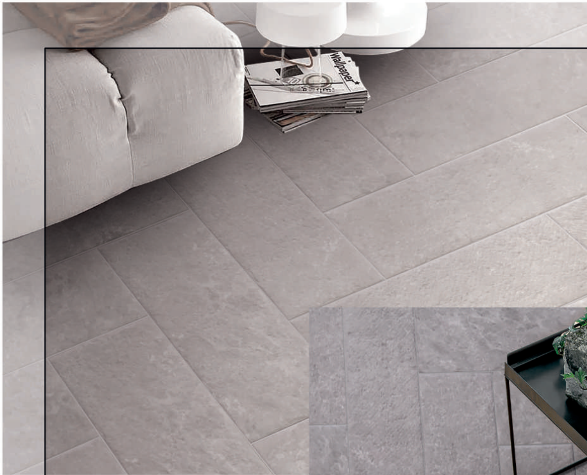
Floor/ Suelo: Abadia Grey 21 x 56 cm