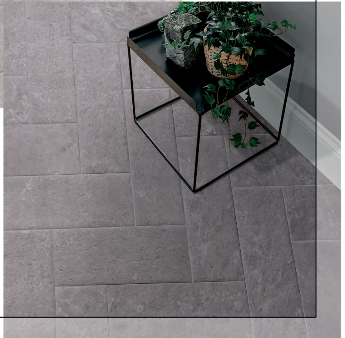
Floor/ Suelo: Abadia Marengo 21 x 56 cm