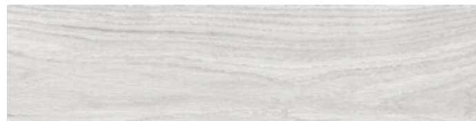
ALBERO WHITE TABLA WHITE