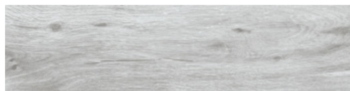
ALBERO GREY TABLA GREY