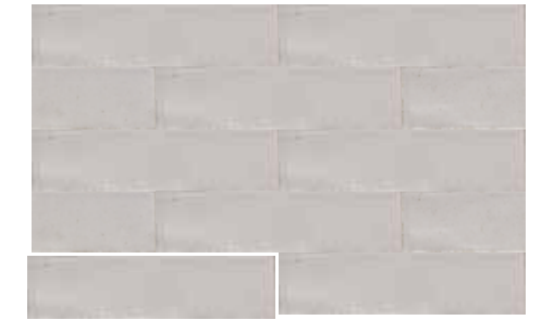
CALPE GREY 7,5X30 / 3"X12" T04/M