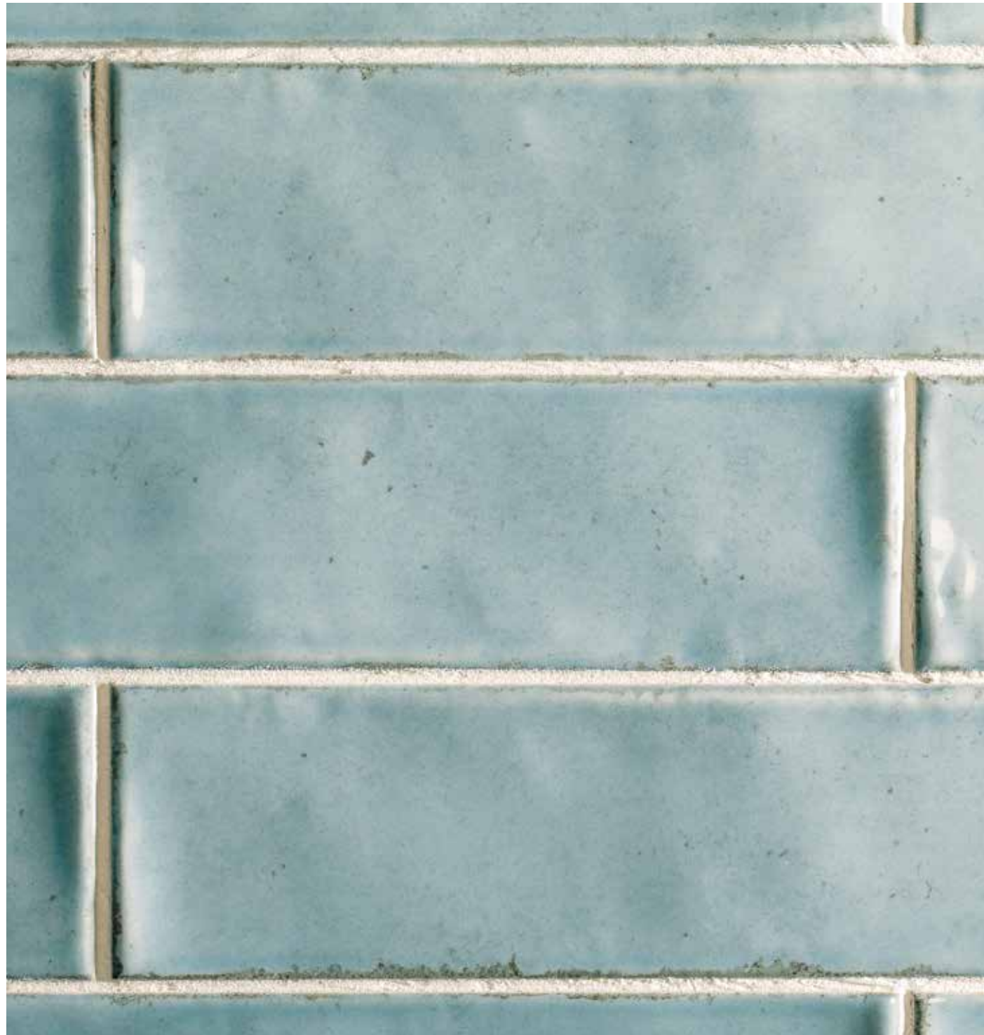
ALTEA SKY 7,5X30.