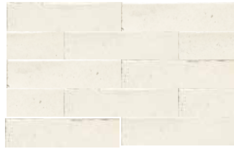
ALTEA IVORY 7,5X30 / 3"X12" T04/M