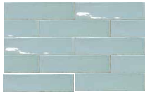
ALTEA SKY 7,5X30 / 3"X12" T04/M