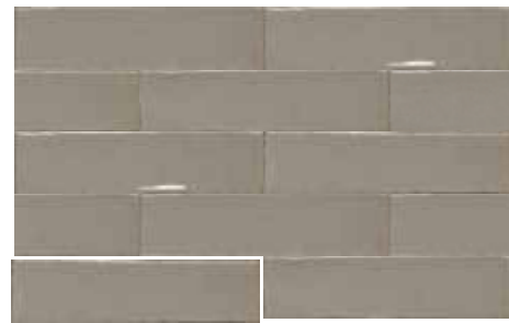
ALTEA TAUPE 7,5X30 / 3"X12" T04/M