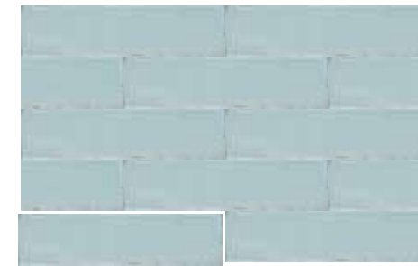
CALPE SKY 7,5X30 / 3"X12" T04/M