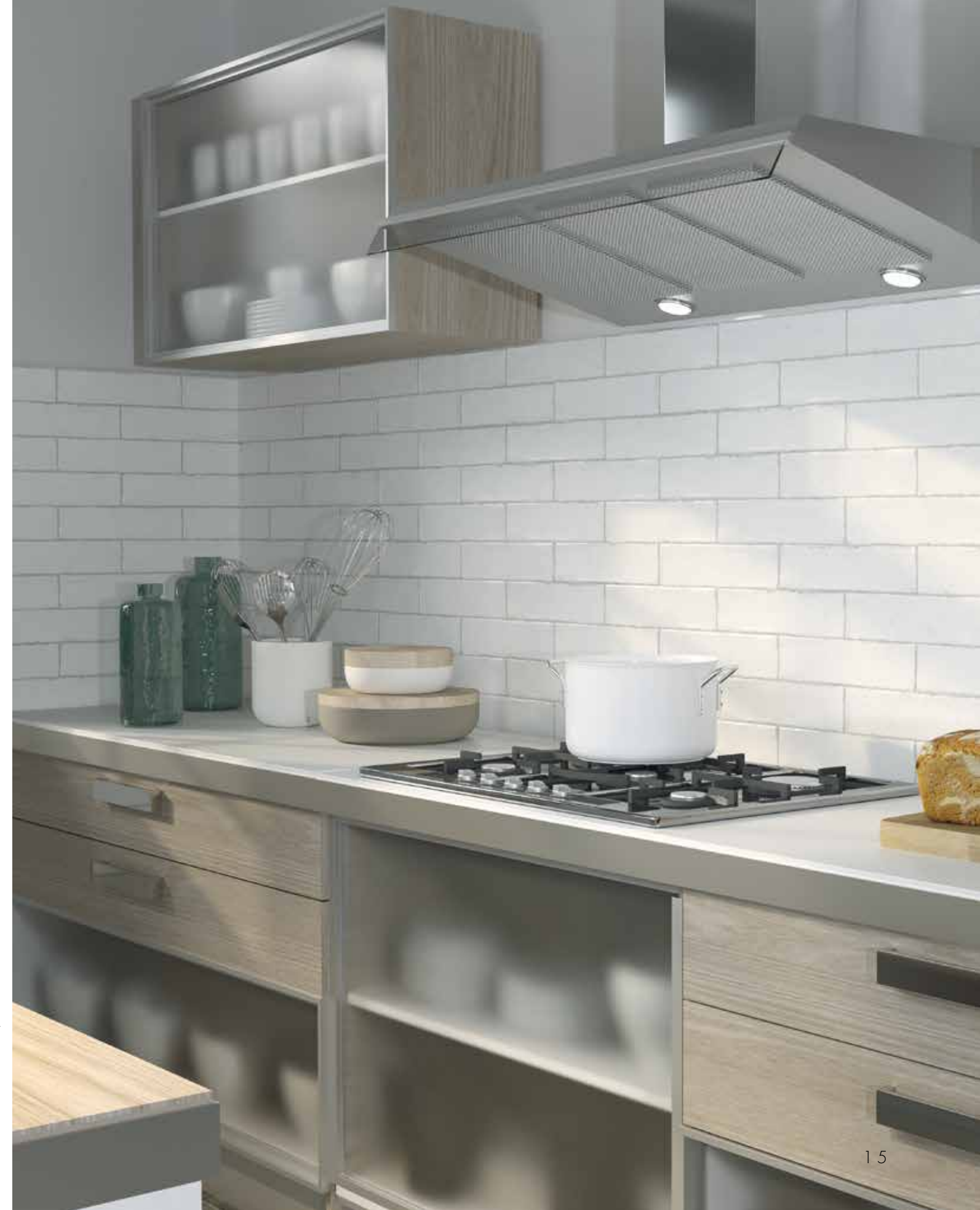
ALTEA WHITE 7,5X30.