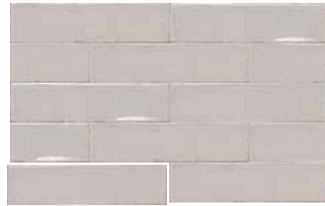
ALTEA GREY 7,5X30 / 3"X12" T04/M