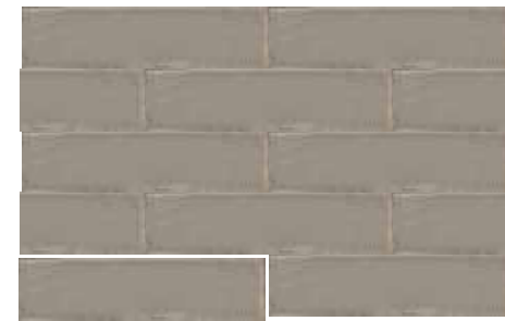
CALPE TAUPE 7,5X30 / 3"X12" T04/M