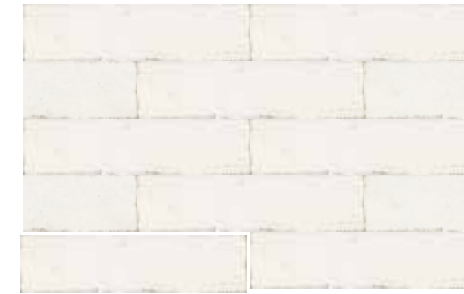
CALPE WHITE 7,5X30 / 3"X12" T04/M