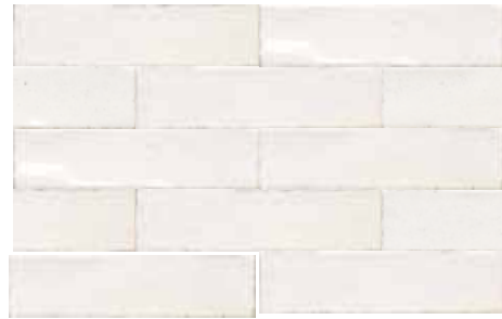
ALTEA WHITE 7,5X30 / 3"X12" T04/M