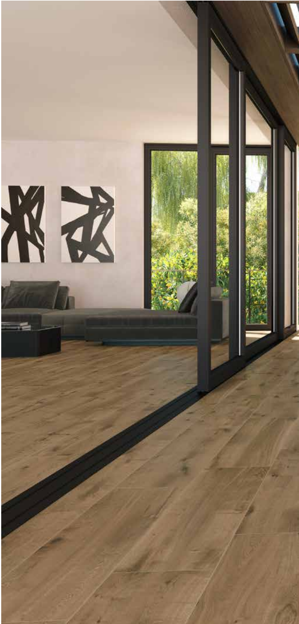
Amazonia CANELA 30x120 cm