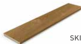
SKIRTING BOARD RODAPIÉ 9x45