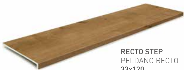
RECTO STEP PELDAÑO RECTO 33x120