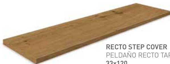
RECTO STEP COVER PELDAÑO RECTO TAPA 33x120