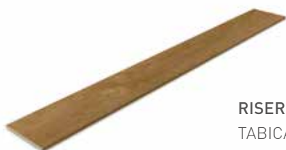
RISER TABICA 14.5x120