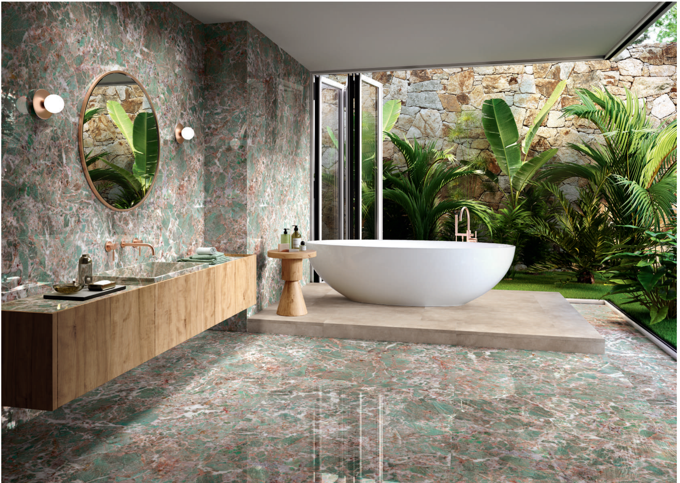
AMAZZONITE RECT. 60X120 / AMAZZONITE RECT. 120X120 / WORK B TAUPE RECT. 60X120