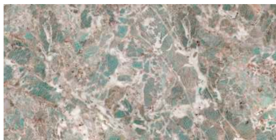
* AMAZONITE POL. RECT. 60X120 / 24"X48" P34/M