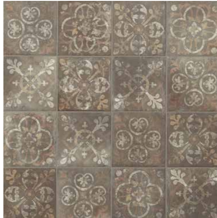
AMERICAN HARVARD (MIX) 22,5 x 22,5 (G-57) 8,8" x 8,8" m 2