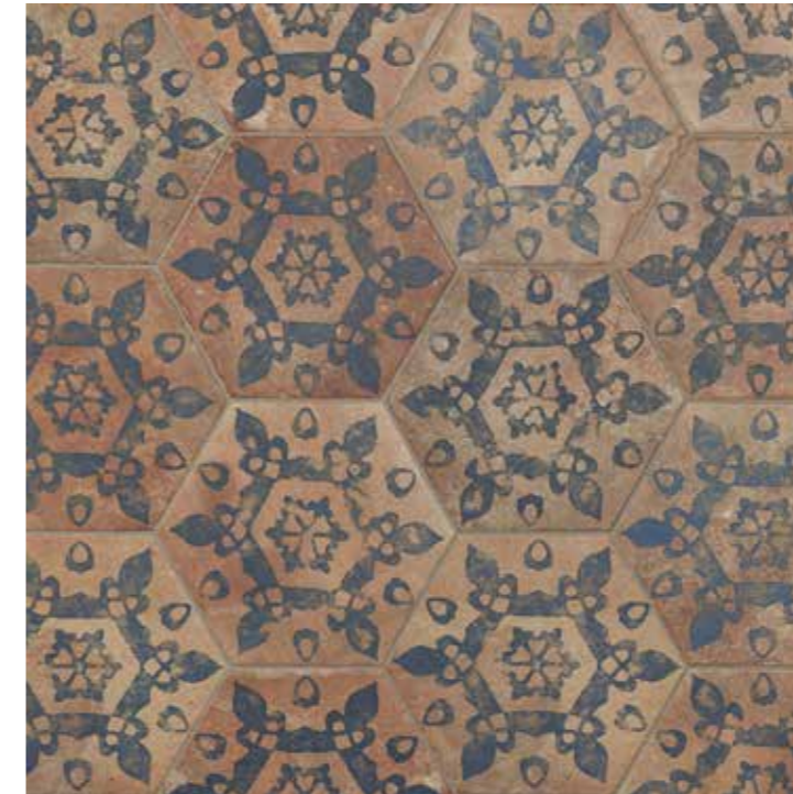
AMERICAN CHARLESTOWN HEX. 28,5 x 32,5 (G-59) 11,2" x 12,7" m 2