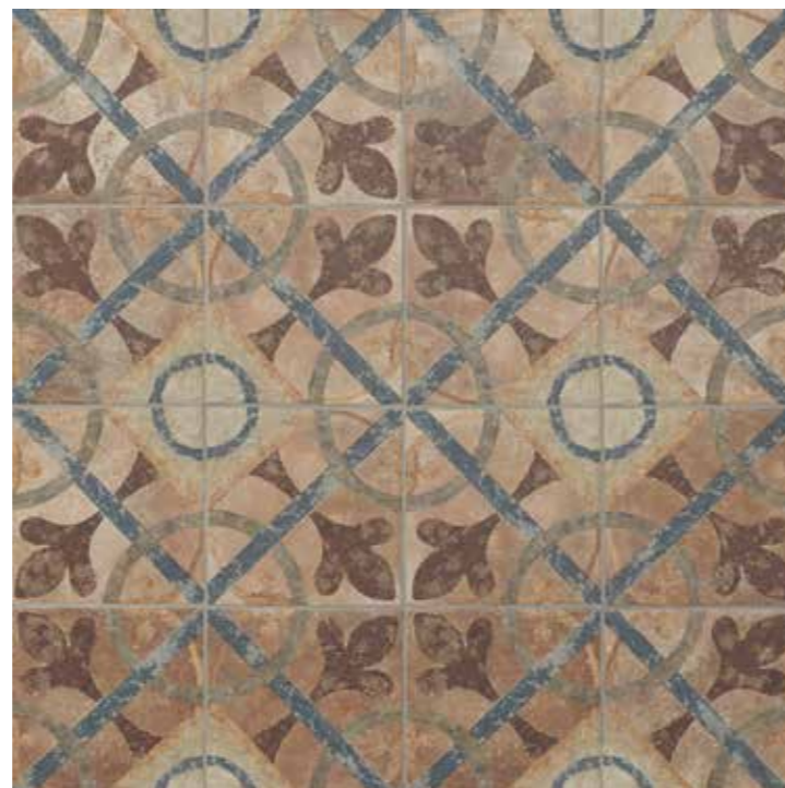
AMERICAN CLEVELAND 22,5 x 22,5 (G-57) 8,8" x 8,8" m 2