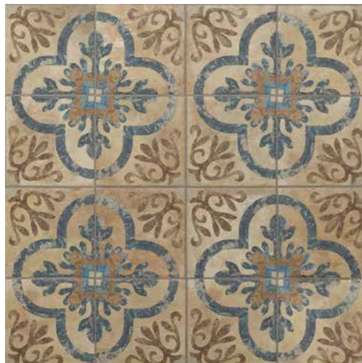
AMERICAN NEWTON 22,5 x 22,5 (G-57) 8,8" x 8,8" m 2