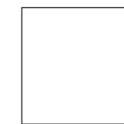
22,5 x 22,5 8,8" x 8,8"