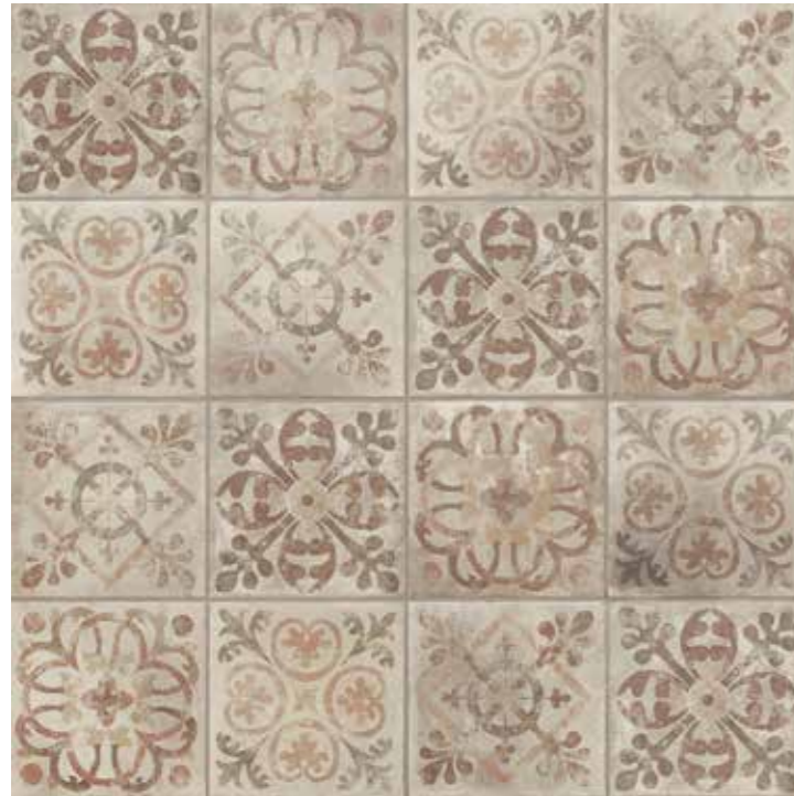
AMERICAN MELROSE (MIX) 22,5 x 22,5 (G-57) 8,8" x 8,8" m 2

* Para cada uso específico consultar nuestro Catálogo Técnico de Colocación - For specific applications, please see our technical installation catalogue