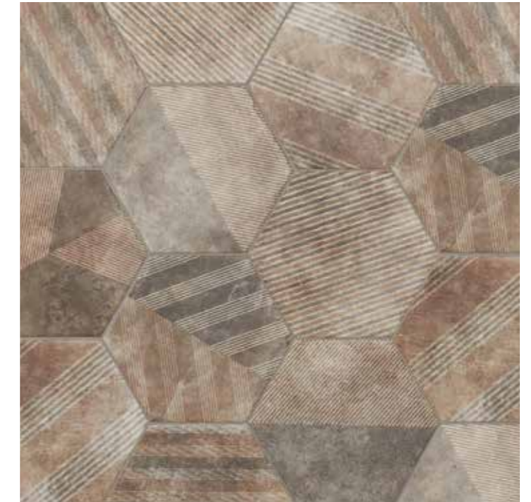
AMERICAN MISSION HEX. (MIX) 28,5 x 32,5 (G-59) 11,2" x 12,7" m 2