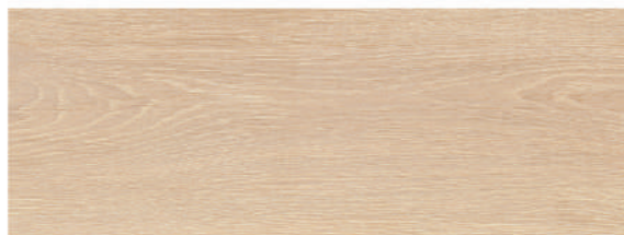
Andia Pino 21,5 x 58 CM GT2