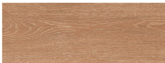
Andia Cerezo 21,5 x 58 CM GT2