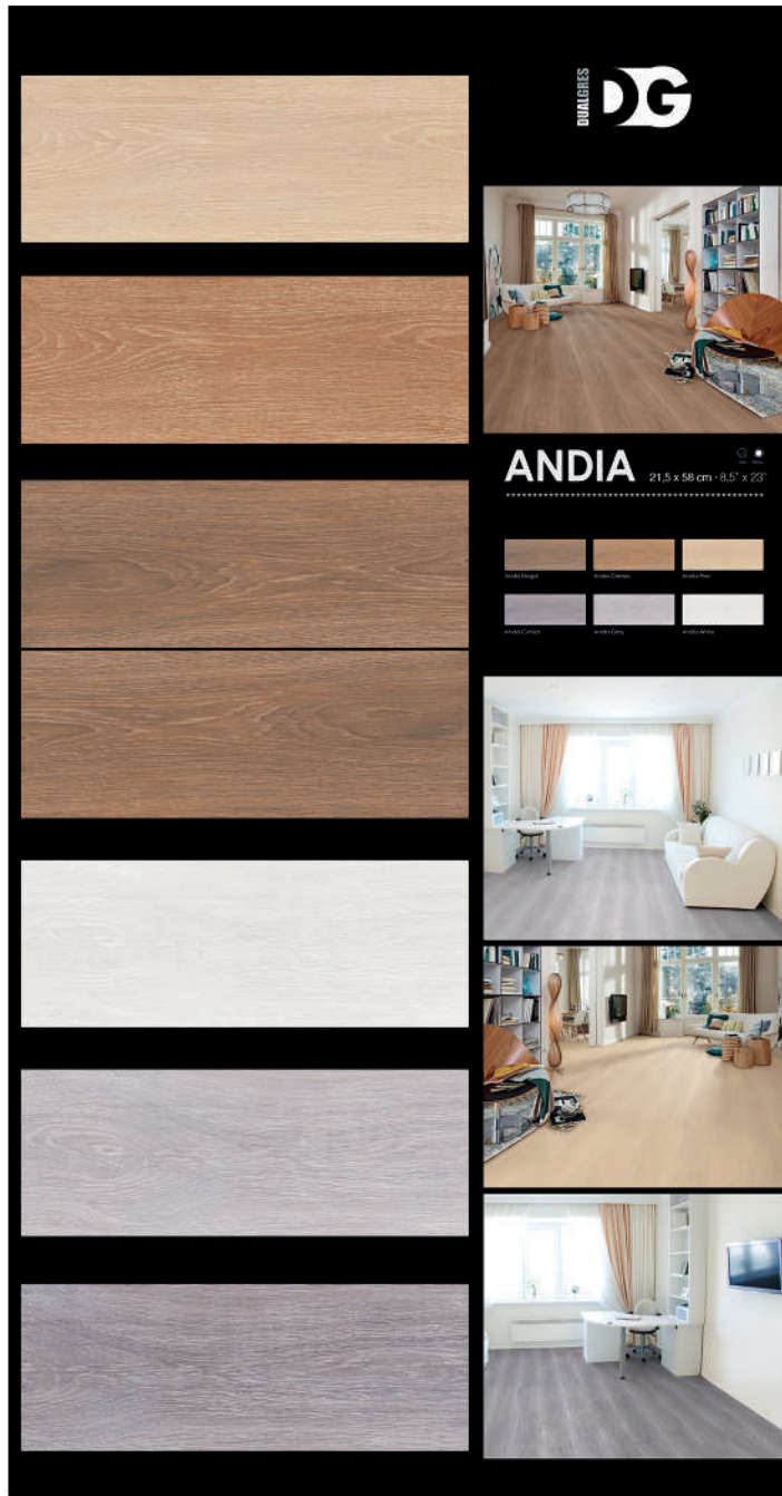
D20_033 · PANEL ANDIA