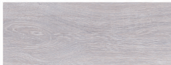
Andia Grey 21,5 x 58 CM GT2