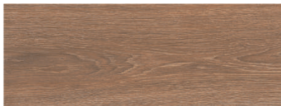
Andia Nogal 21,5 x 58 CM GT2