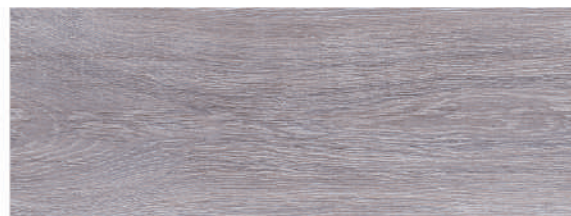
Andia Ceniza 21,5 x 58 CM GT2