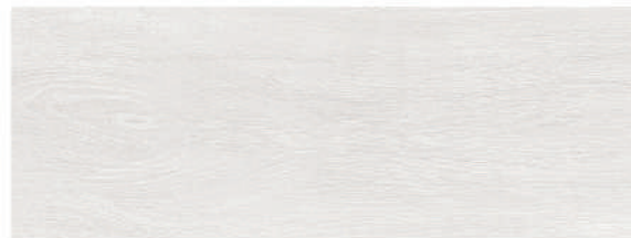
Andia White 21,5 x 58 CM GT2