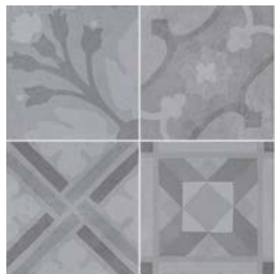
Encants Alabaster 26461 EQ-5