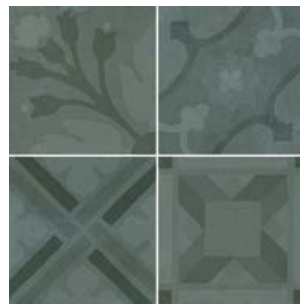
Encants Aqua 26458 EQ-5