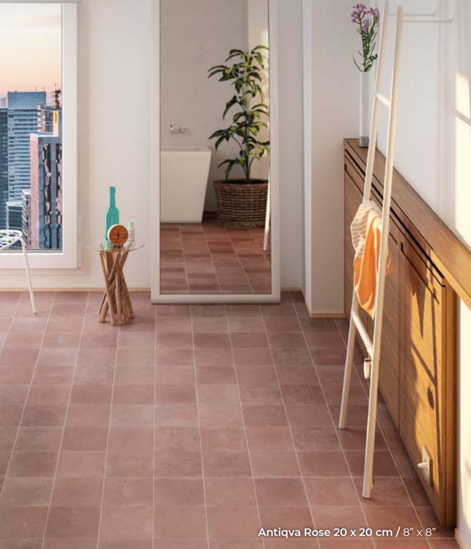
Antiqua Rose 20 x 20 cm / 8" x 8"