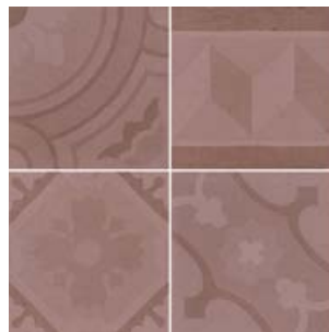
Encants Rose 26459 EQ-5