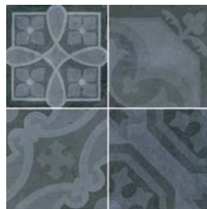
Encants Blue 26455 EQ-5