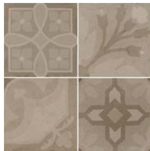
Encants Ochre 26456 EQ-5