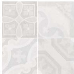
Encants White 26453 EQ-5