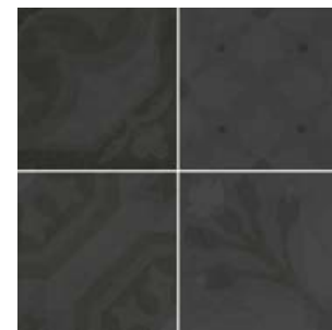
Encants Graphite 26460 EQ-5

Estos modelos están compuestos por diseños diferentes que se sirven en la misma caja de modo aleatorio. 16 piezas diferentes.