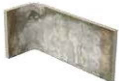
Angolo interno / AZ 5 10x20x10 cm 4x8x4 in Inside corner Innen-Ecke Angle intérieur 030