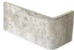
Angolo esterno / AZ 5 10x20x10 cm 4x8x4 in Out corner Aussenecke Angle extérieur 030