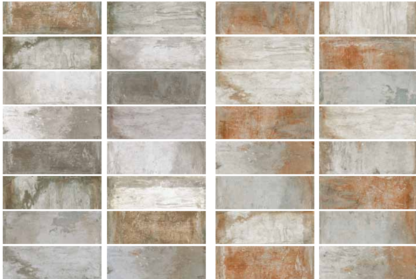
AZ 5 / Grigio 10x30 cm 4x12 in 092