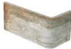
Angolo esterno / AZ 6 10x20x10 cm 4x8x4 in Out corner Aussenecke Angle extérieur 030