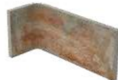
Angolo interno / AZ 6 10x20x10 cm 4x8x4 in Inside corner Innen-Ecke Angle intérieur 030