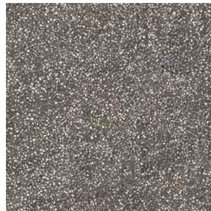
M2HE Art20 Anthracite 80x80

Pezzi Speciali Special Trims Pièces Spéciales Formteile Piezas Especiales Специальные Изделия