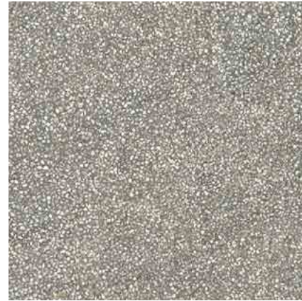
M2HC Art20 Grey 80x80