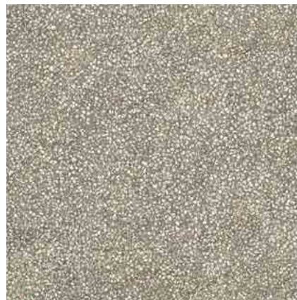
M2H6 Art20 Taupe 80x80