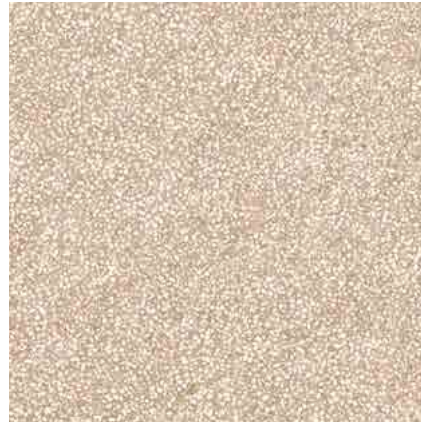
M2H4 Art20 Beige 80x80