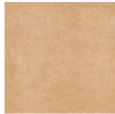
EDICER MONSARAZ AREIA *** 33x33 NAT P57