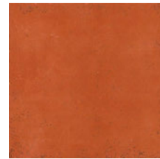
EDICER MONSARAZ TERRACOTA *** 33x33 NAT P57