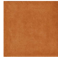
EDICER MONSARAZ ÂMBAR *** 33x33 NAT P57