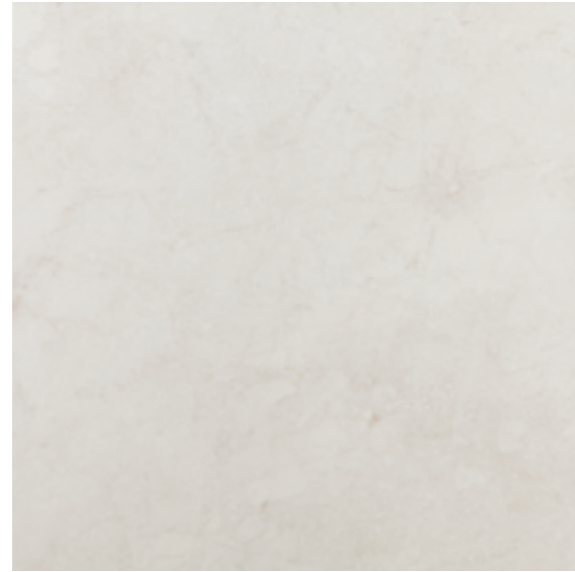
PEI 4 ● At. Mys Nacar 60x60 Rec. M28 017.840.0030.04105