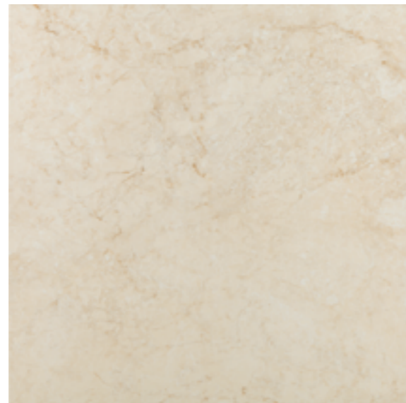
PEI 4 ● At. Mys Marfil 60x60 Rec. M28 017.840.0033.04105