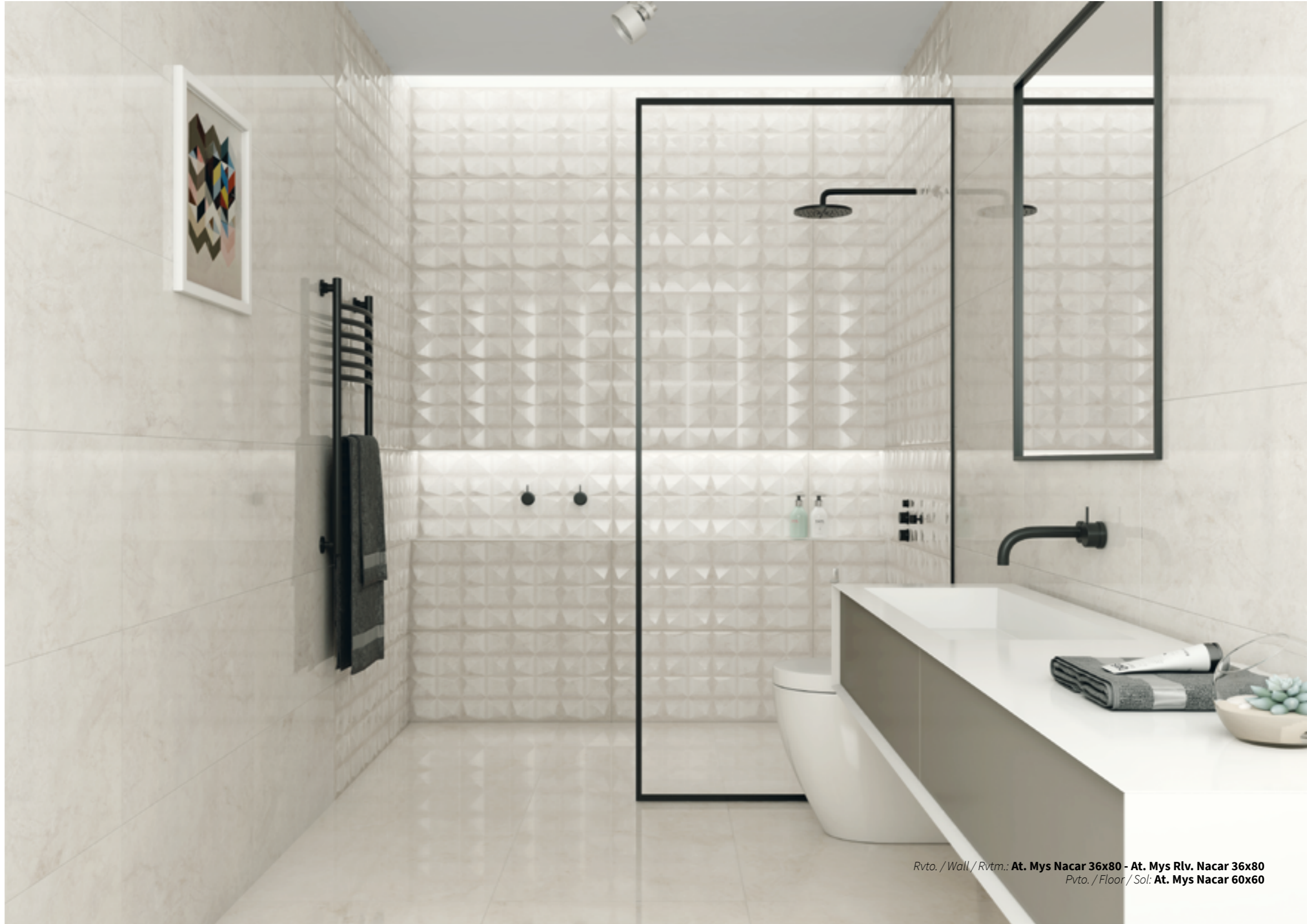
Rvto. / Wall / Rvrm.: At. Mys Nacar 36x80 - At. Mys Rlv. Nacar 36x80 Pvto. / Floor / Sol: At. Mys Nacar 60x60

Revestimiento Coordinado / Coordinated Wall Tile / Revêtement Coordinné: At. Mys 36x80 - Rvto. Pasta blanca / White body wall tiles / Revêtement pâte blanche - Pág/Page/Page 360