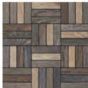
Malla PEKÍN Antic 30x30 P47 9.635.203.664