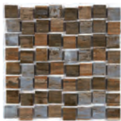
Malla CADENA Happy 30x30 P47 9.635.343.663