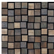
Malla CADENA Antic 30x30 P47 9.635.203.663