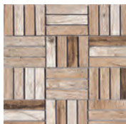
Malla PEKÍN Cocoa 30x30 P47 9.635.265.664