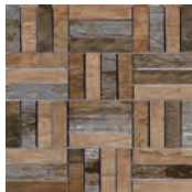
Malla PEKÍN Happy 30x30 P47 9.635.343.664