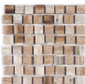
Malla CADENA Cocoa 30x30 P47 9.635.265.663