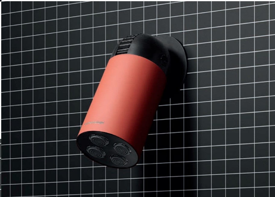
CORPO NERO OPACO | CILINDRO TERRACOTTA OPACO