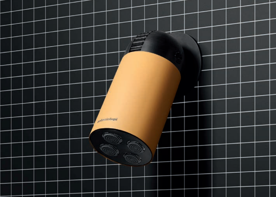
CORPO NERO OPACO | CILINDRO COCCODRILLO OPACO