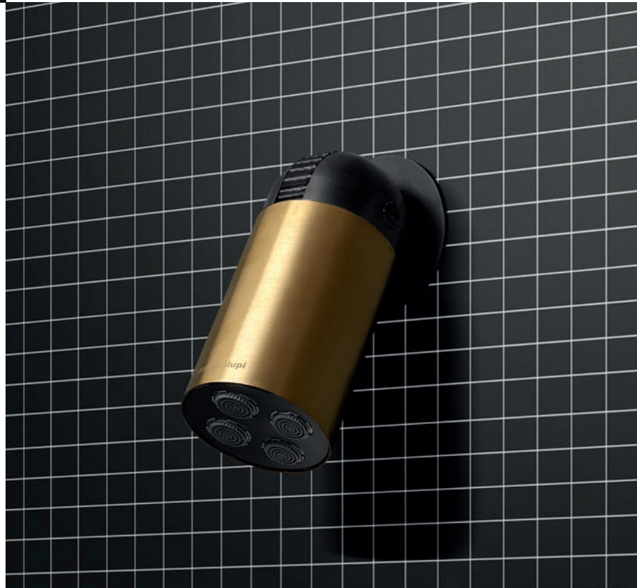
CORPO NERO OPACO | CILINDRO OTTONE SATINATO NATURALE