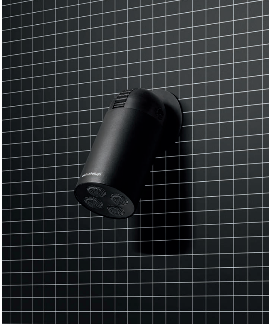
CORPO NERO OPACO | CILINDRO NERO OPACO MATT BLACK BODY | MATT "NERO" CYLINDER