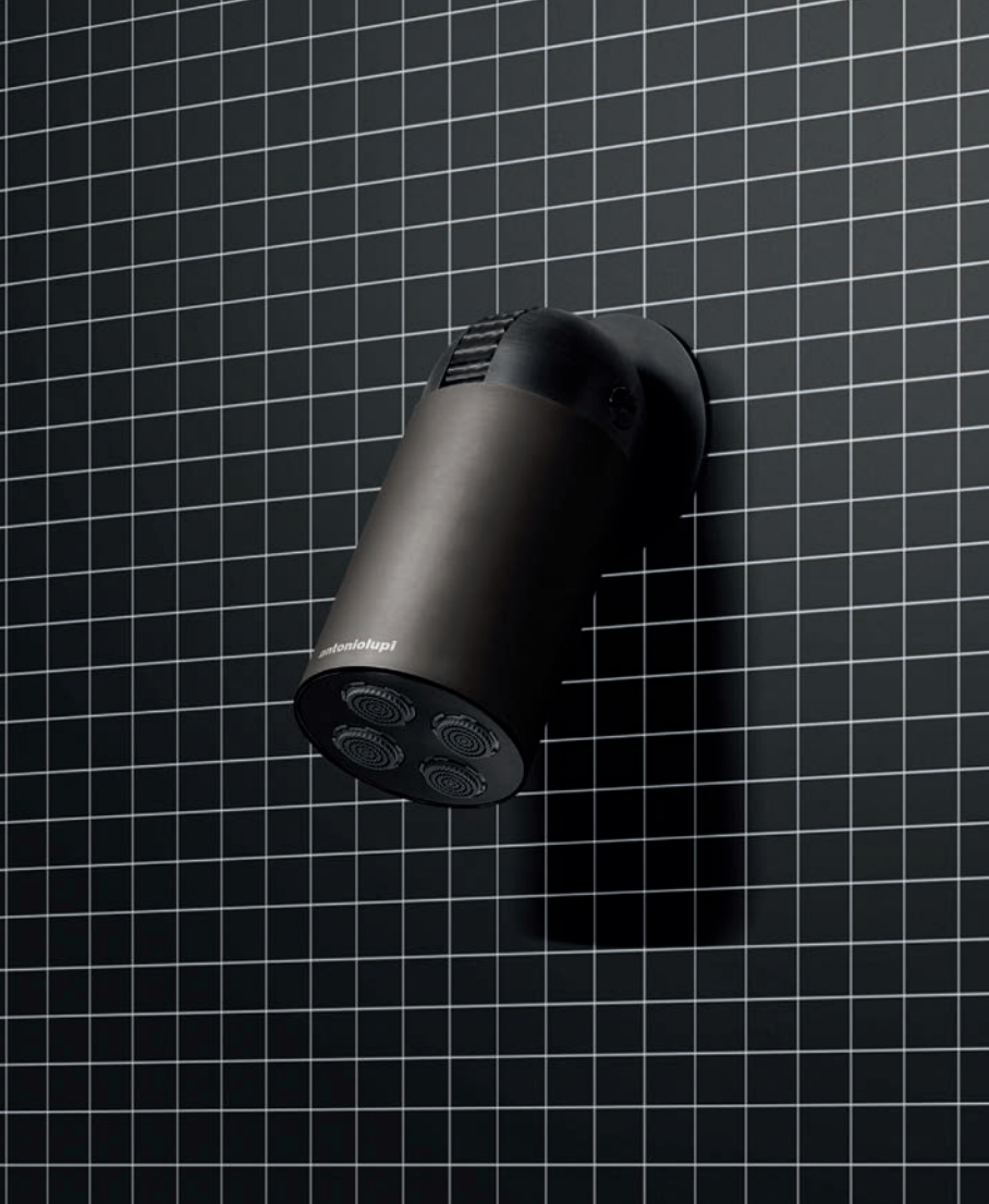
CORPO NERO OPACO | CILINDRO GRAFITE