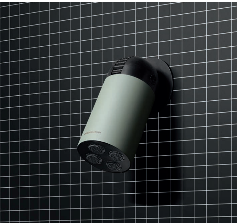
CORPO NERO OPACO | CILINDRO LAMBRETTA OPACO