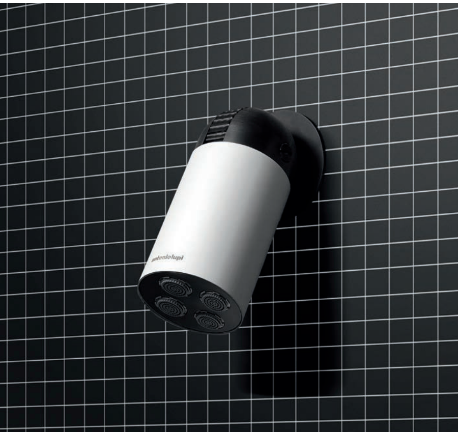
CORPO NERO OPACO | CILINDRO BIANCO OPACO MATT BLACK BODY | MATT "BIANCO" CYLINDER