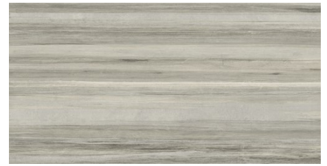
BLEND GREY MIX