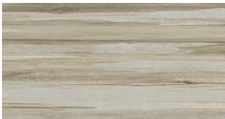
BLEND SAND MIX