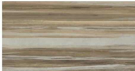
BLEND NATURE MIX