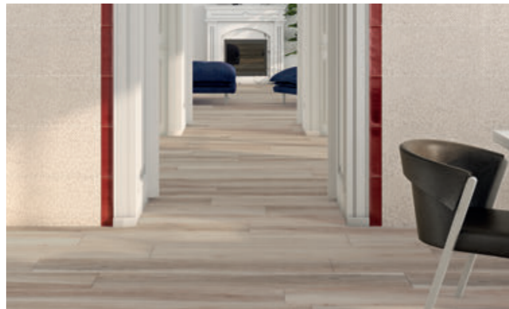
Foor tile Bohars Olivo 25x150.

Disponible en todos los colores. Available in all colours. Disponible dans tous les coloris.