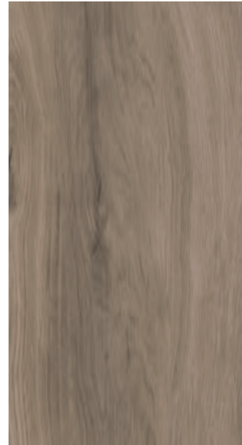
Sand NCS S 2010Y20R