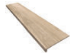
Peldaño Extrusionado / Extruded Step 1200x320x30 P 40

Disponible en todos los colores. Available in all colours. Disponible dans tous les coloris.