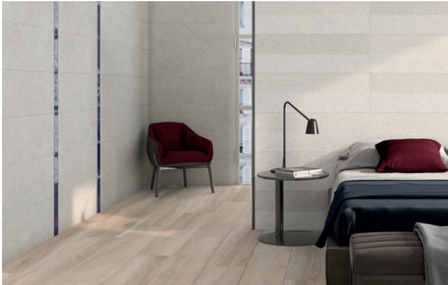
Floor tile Bohars Olivo 25x150. Wall tile Roadstone Pearl 30x90, Maiolica Royalblue 7,5x30 and Dc. Roadstone Mix 30x90.