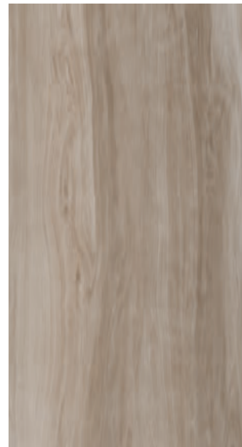
Olivo NCS S 3005Y20R