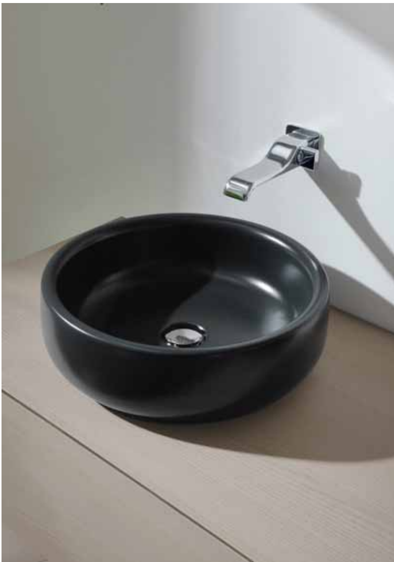
Bonola 46 _ Carbone art. BN46A - ø 46 x h 14,5 cm