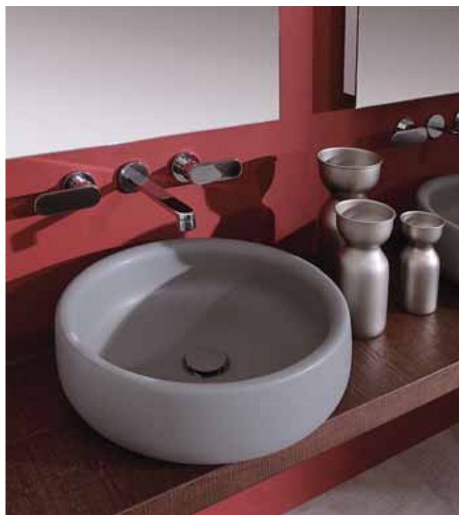
Bonola 46 _ Grigio Lava art. BN46A - ø 46 x h 14,5 cm