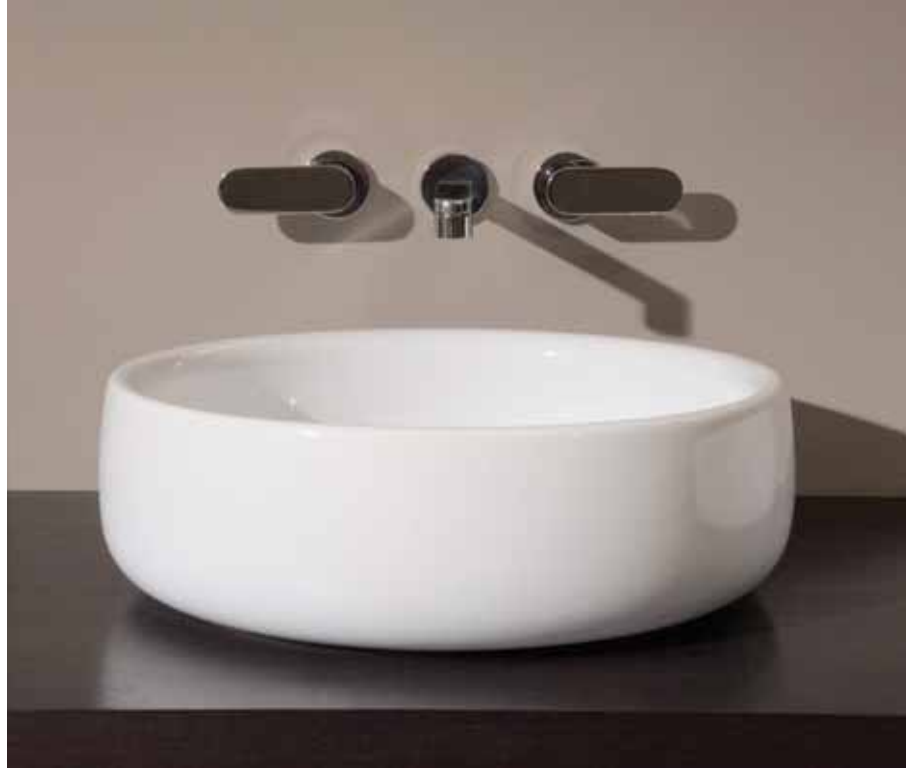
Bonola 50 art. BN50A - ø 50 x h 15,5 cm