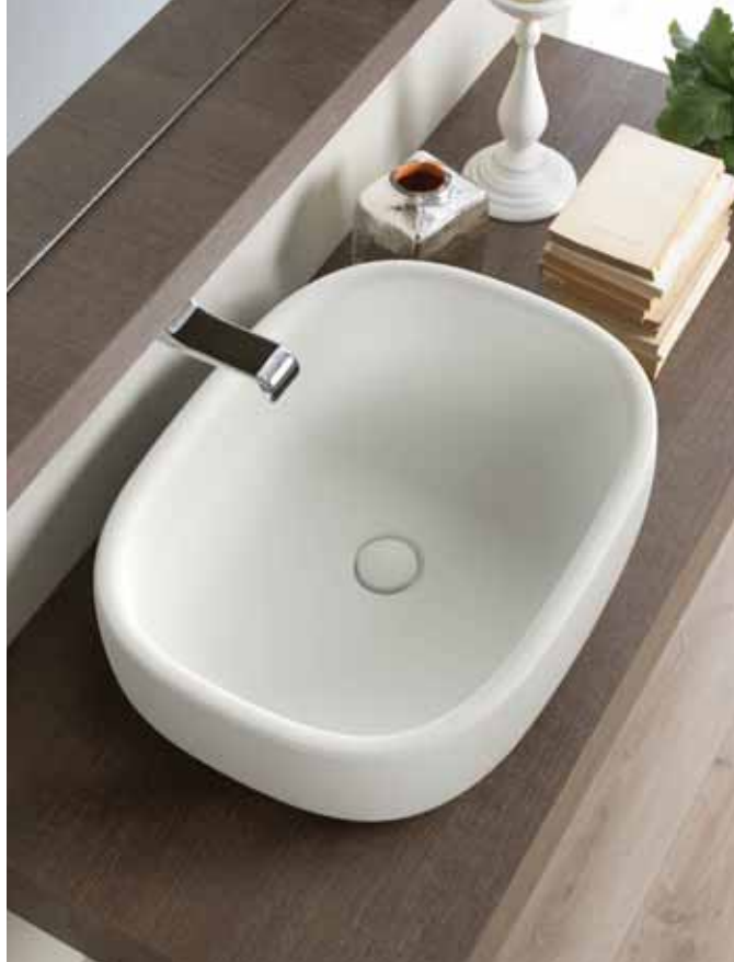
Bonola 60 _ Latte art. BN60A - 62 x 48 x h 16 cm