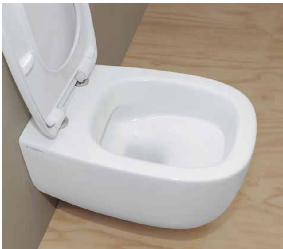
Bonola goclean® art. BN118G - 54 x 38 x h 27 cm