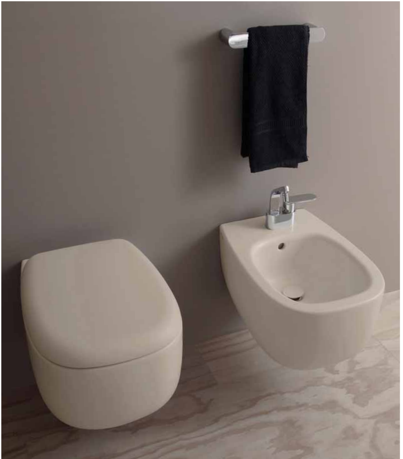
Bonola _ Argilla art. BN118G-BNCW03 / BN218 - 54 x 38 x h 27 cm