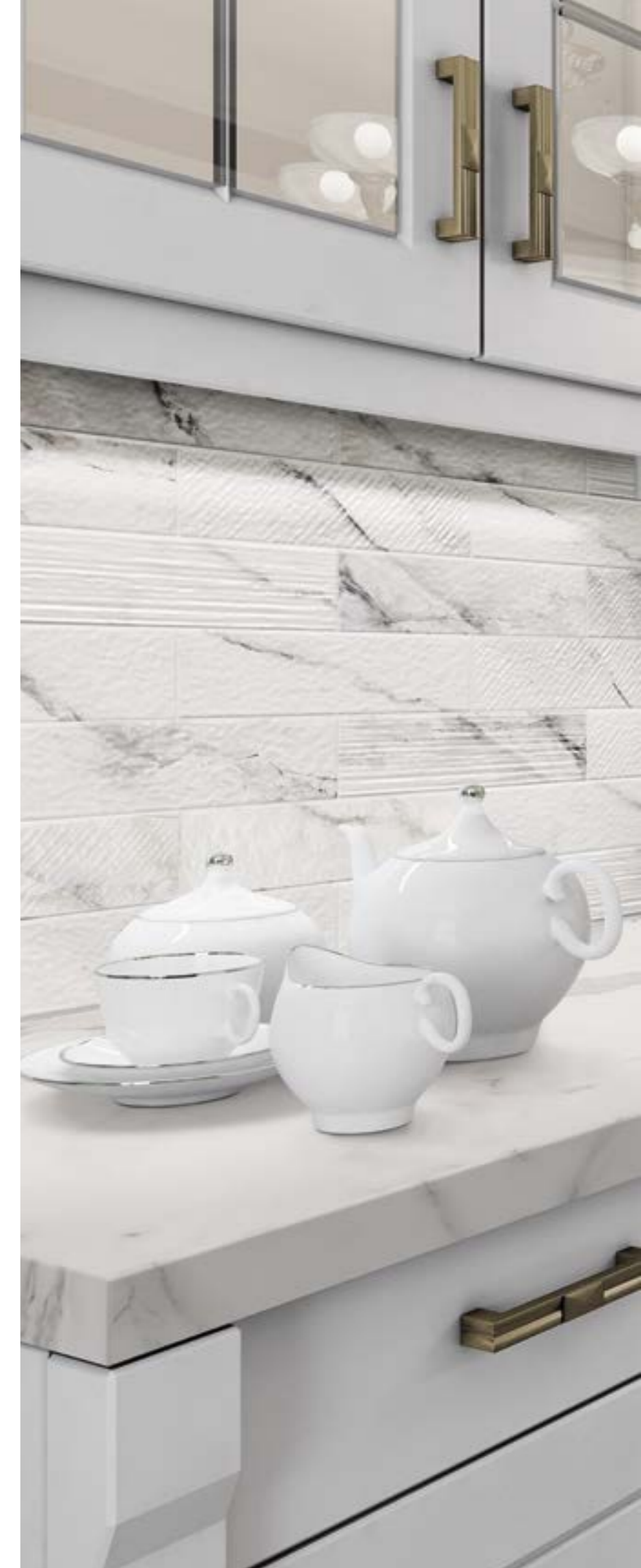
Gallery Decor Carrara 8x33,3 cm. · 3"x13"