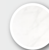
Carrara Blanco Pág. 422