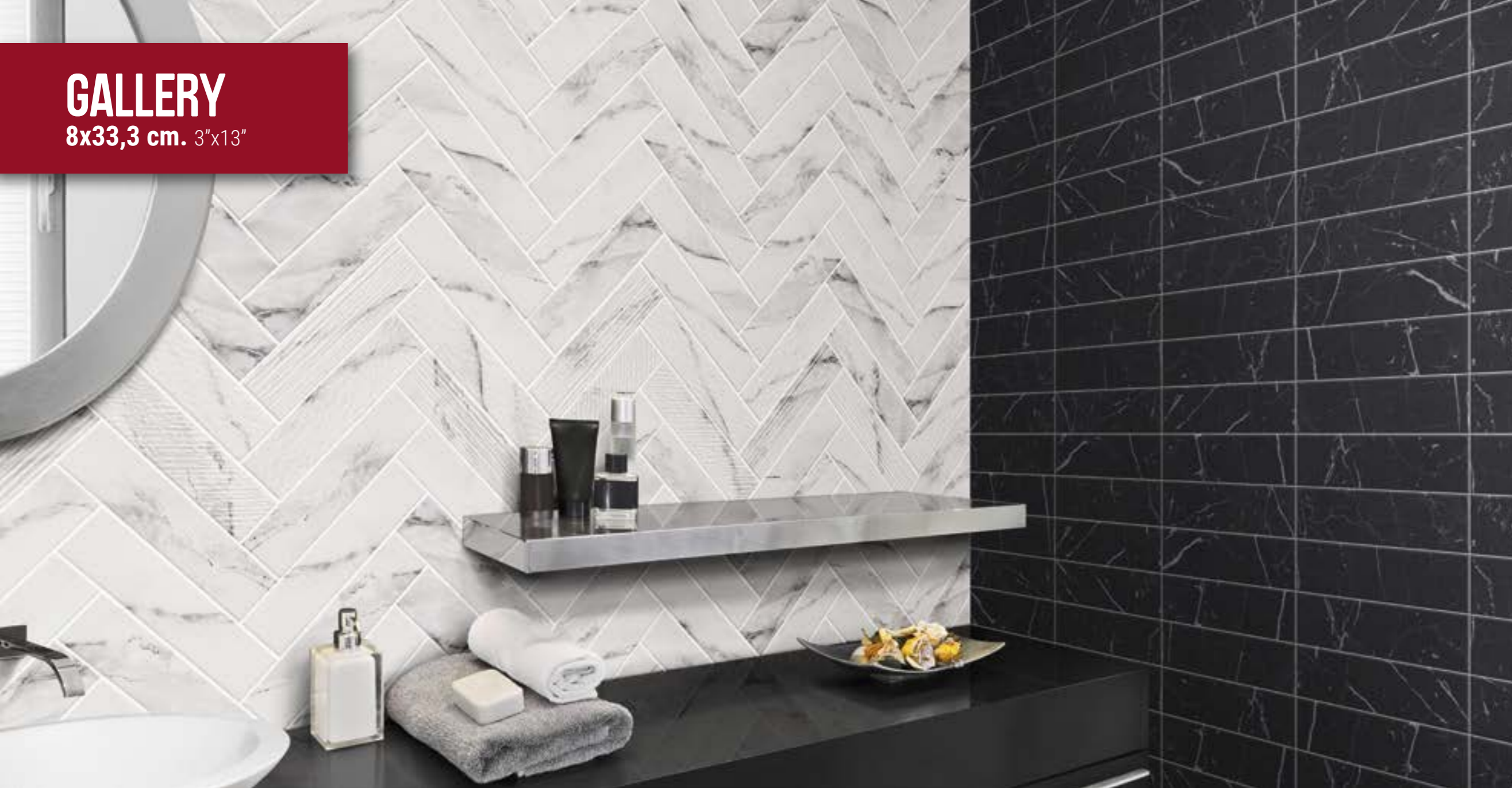
Gallery Carrara 8x33,3 cm. · 3"x13" · Gallery Decor Carrara 8x33,3 cm. · 3"x13" Gallery Marquina 8x33,3 cm. · 3"x13"