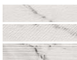
GALLERY DECOR CARRARA 8x33,3 cm. · 3"x13" K-25