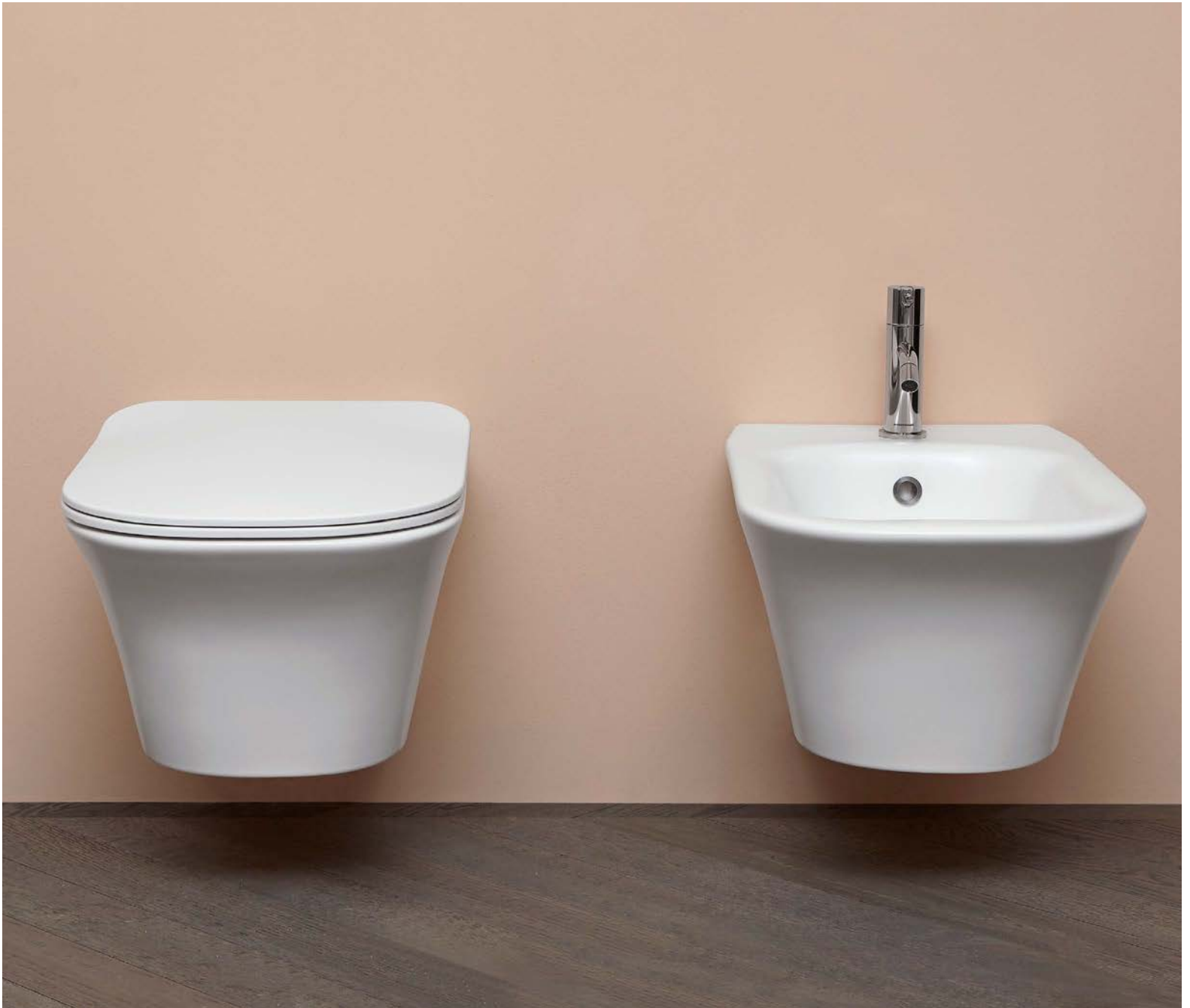
SISTEMA "LESS_RING" / "LESS_RING" FLUSHING SYSTEM