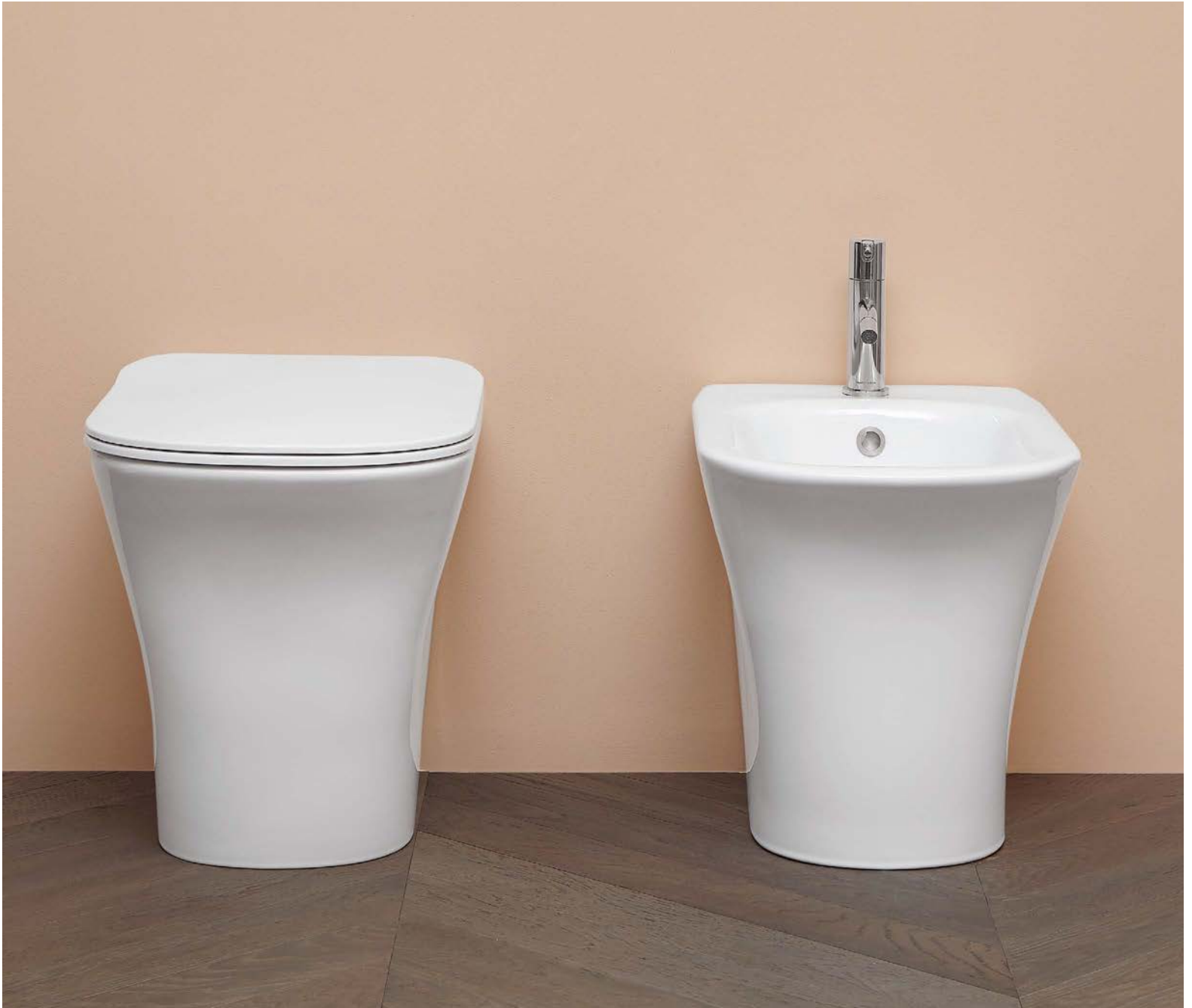
SISTEMA "LESS_RING" / "LESS_RING" FLUSHING SYSTEM