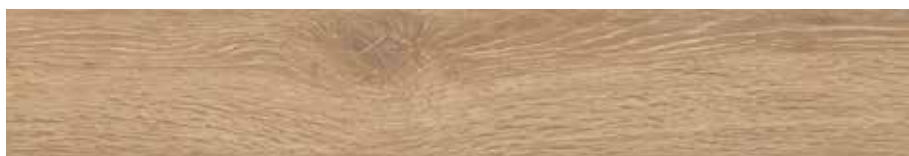
Carpatos Roble 20 x 120 cm.