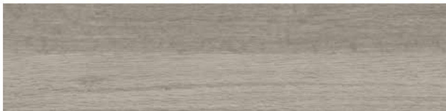
Carpatos Gris 29,5 x 120 cm. 29,5 x 120 cm. Anti-Slip