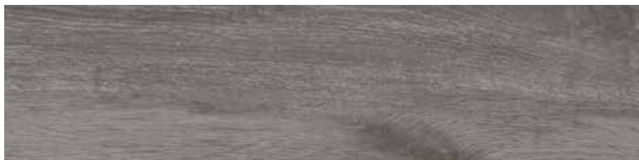
Carpatos Anthracite 29,5 x 120 cm.