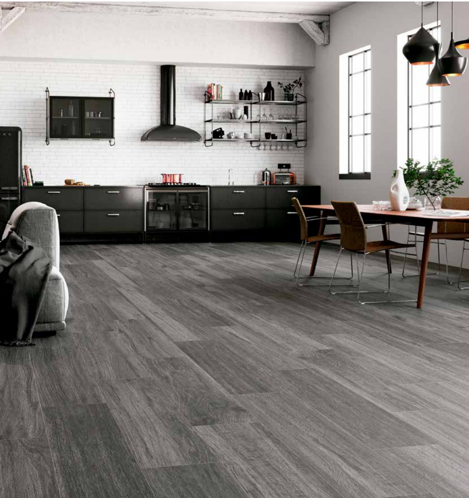
Carpatos Anthracite 29,5 x 120 cm.

29,5 x 120 cm 11,61" x 47,24" 20 x 120 cm 7,87" x 47,24" Porcelánico Porcelain Tiles