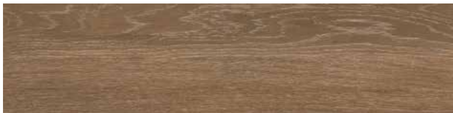
Carpatos Nogal 29,5 x 120 cm.