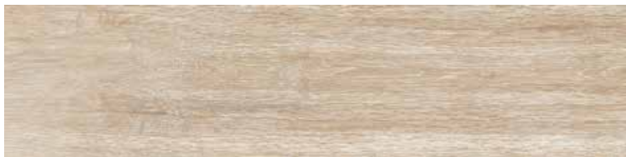
Carpatos Natural 29,5 x 120 cm. 29,5 x 120 cm. Anti-Slip