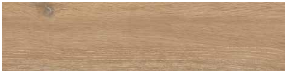
Carpatos Roble 29,5 x 120 cm.