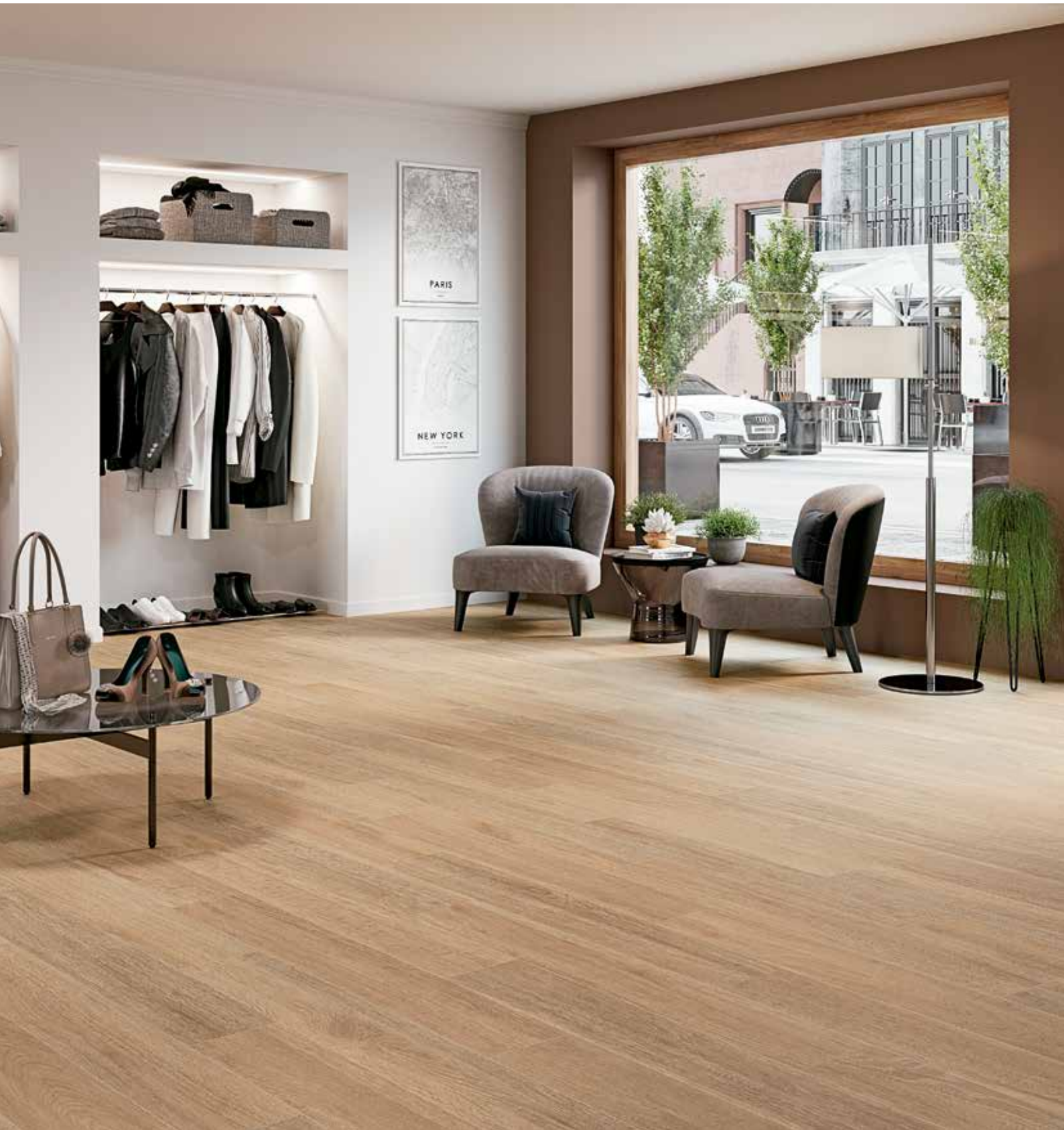
Carpatos Roble 20 x 120 cm.

29,5 x 120 cm 11,61" x 47,24" 20 x 120 cm 7,87" x 47,24" Porcelánico Porcelain Tiles