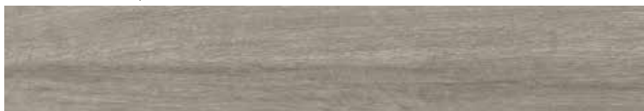
Carpatos Gris 20 x 120 cm. 20 x 120 cm. Anti-Slip