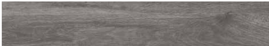
Carpatos Anthracite 20 x 120 cm.