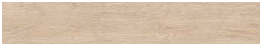
Carpatos Natural 20 x 120 cm. 20 x 120 cm. Anti-Slip