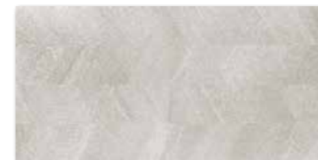
WAKV4533 82 / m 2 mat | matt