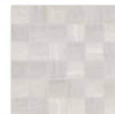
WDM06531 (SET) 66 / set mat | matt

bílá / white / biata / белый / fehér / blanco