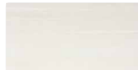
WAKV4530 80 / m 2 mat | matt