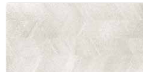
WAKV4532 82 / m 2 mat | matt