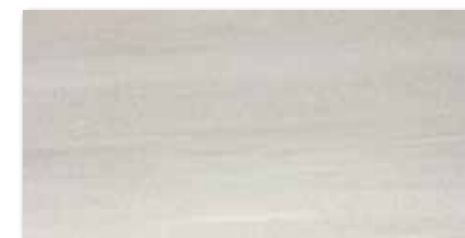
WAKV4531 80 / m 2 mat | matt