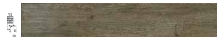
ANTIGUA-T/15,3 B-27 (15,3x91) (4-1-EH) *** R-9 ANTIGUA-T/A/15,3 B-29 (15,3x91) (4-3-EH) *** R-12