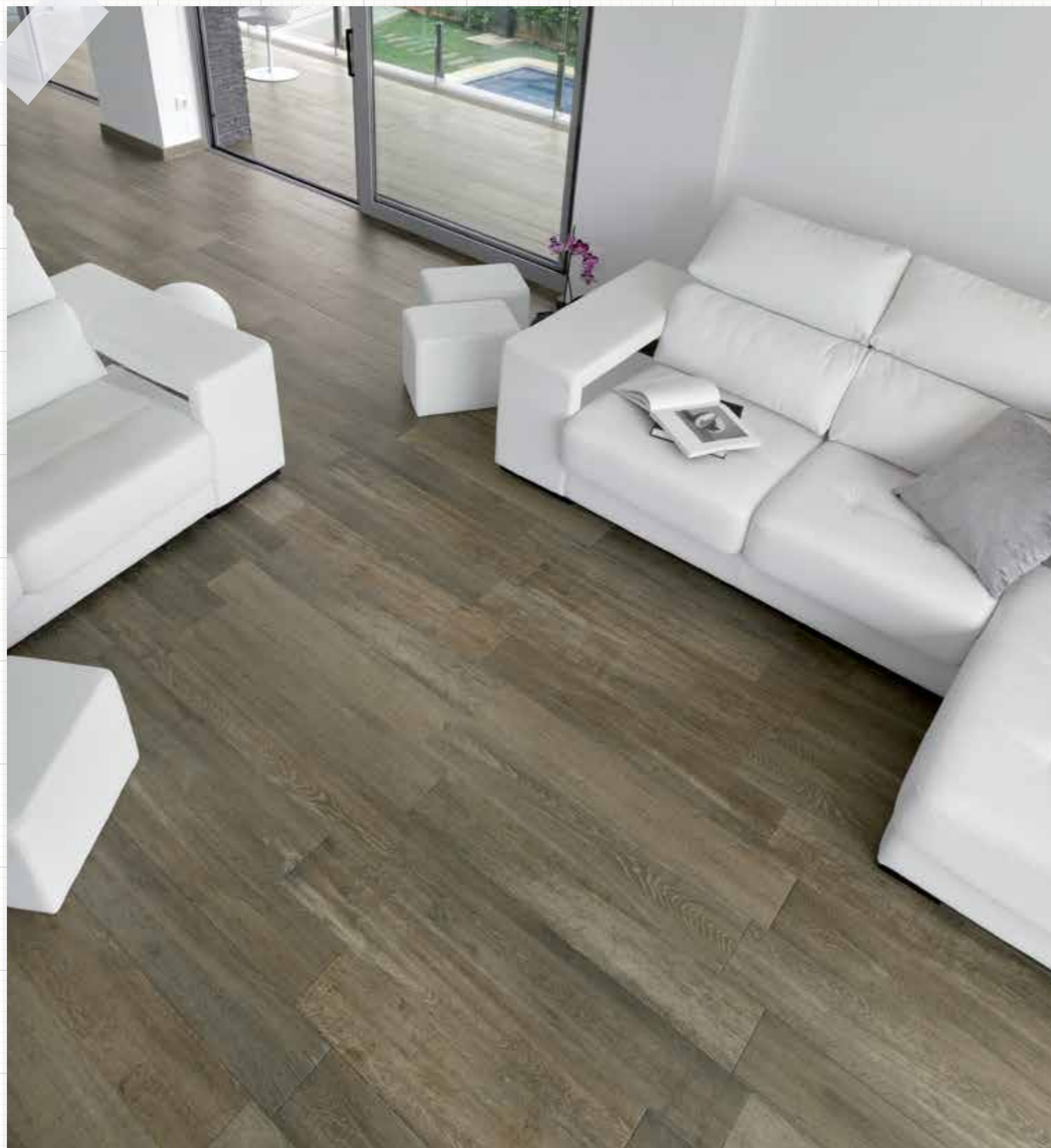
*Antigua-T/15,3 Antigua-T/A/15,3 R. Antigua-T