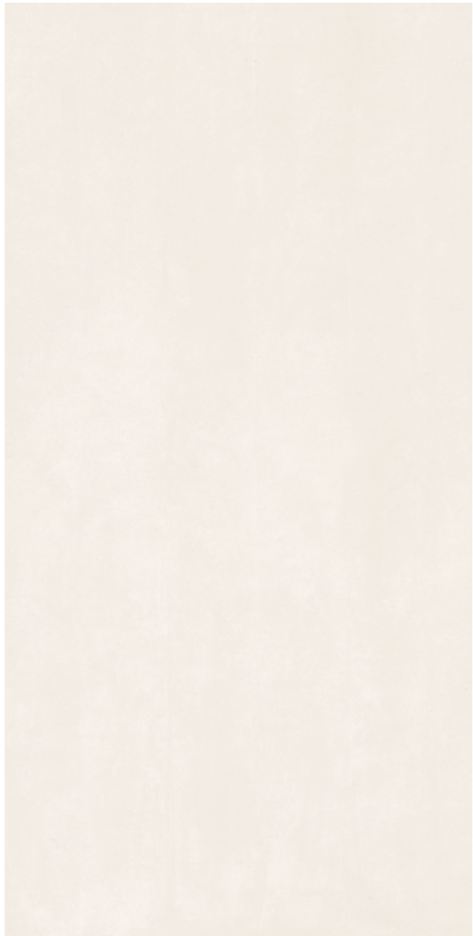
19295 SCOTT-B/1,5x3/MAT B-47 (150x300x0,6)