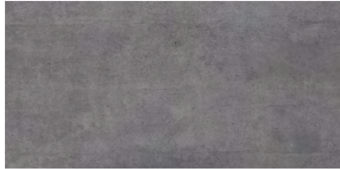
19297 SCOTT-G/0,75x1,5/MAT B-47 (75x150x0,6)