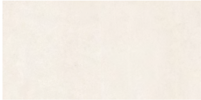
19300 SCOTT-B/0,75x1,5/MAT B-47 (75x150x0,6)