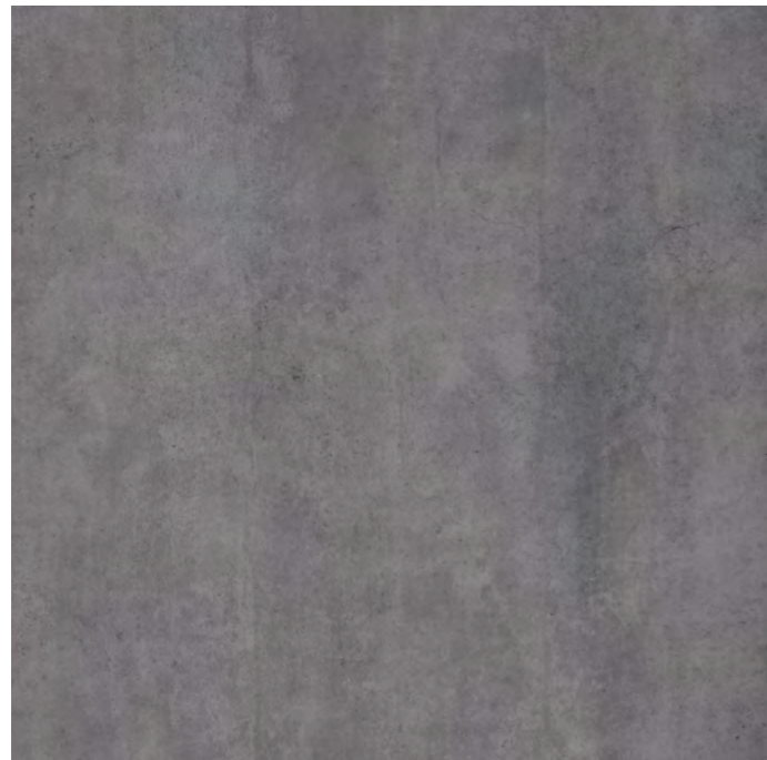
18540 SCOTT-G/1,5x1,5/MAT B-47 (150x150x0,6)