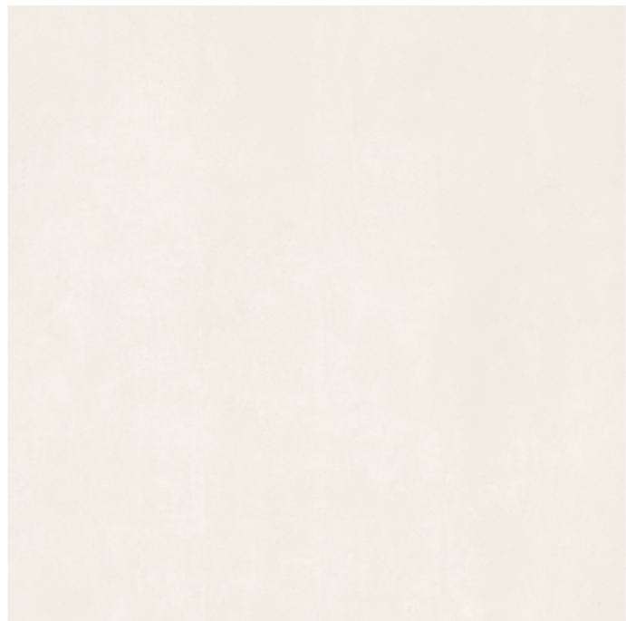
19294 SCOTT-B/1,5x1,5/MAT B-47 (150x150x0,6)