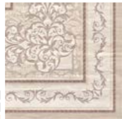
13755 E.D. ALBAES-B/R P-64 (32x32) 13754 E.D. ALBAES-B P-62 (33x33)