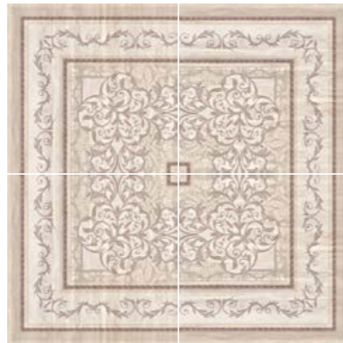
4 piezas E.D. ALBAES. Ejemplo de colocación 4 pieces. Lying example