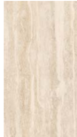
13515 SIUL-B/R B-25 (32x59) 13513 SIUL-B B-19 (33x60)