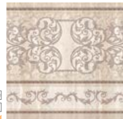
13757 L.D. ALBAES-B/R P-64 (32x32) 13756 L.D. ALBAES-B P-62 (33x33)