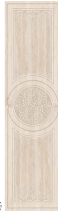
*13735 D. FLAMENCO-B/R P-78 (32x59) *13734 D. FLAMENCO-B P-69 (33x60)