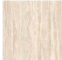
13517 OMIK-B/R B-23 (32x32) 13516 OMIK-B B-14 (33x33) (4-0-H)****