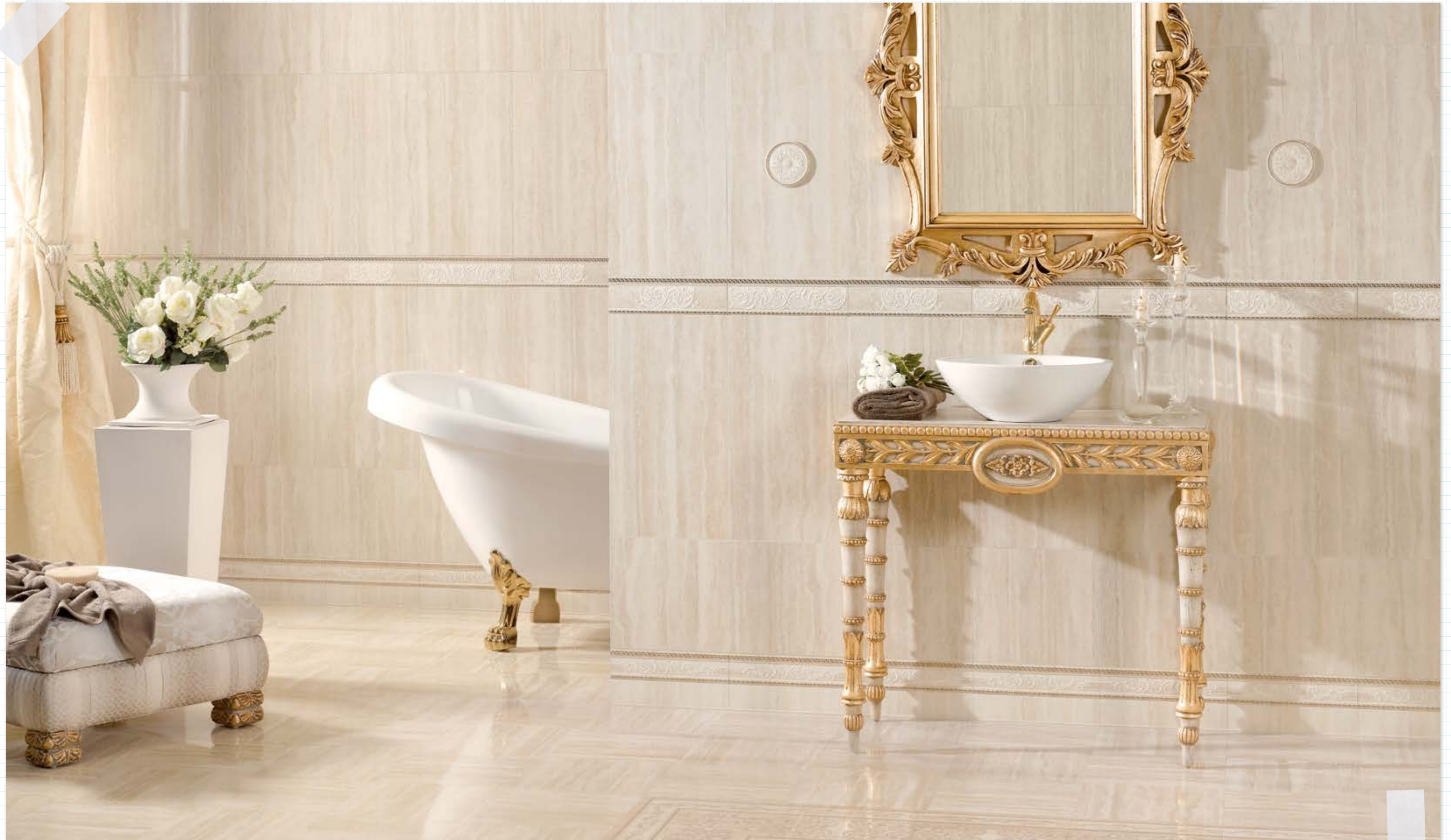
*Siul-β/R C. Serenata-β/R Zoc. Serenata-β/R T.l. Serenata-β L.d. Albaes-β/R E.d. Albaes-β/R