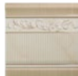
Majestic Ivory Zócalo 20 x 20 cm C-345