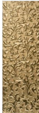
Epic Gold Decor 20 x 59,2 cm C-358