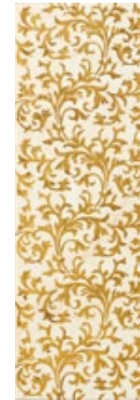
Lineage Ivory-Gold Decor 20 x 59,2 cm C-355