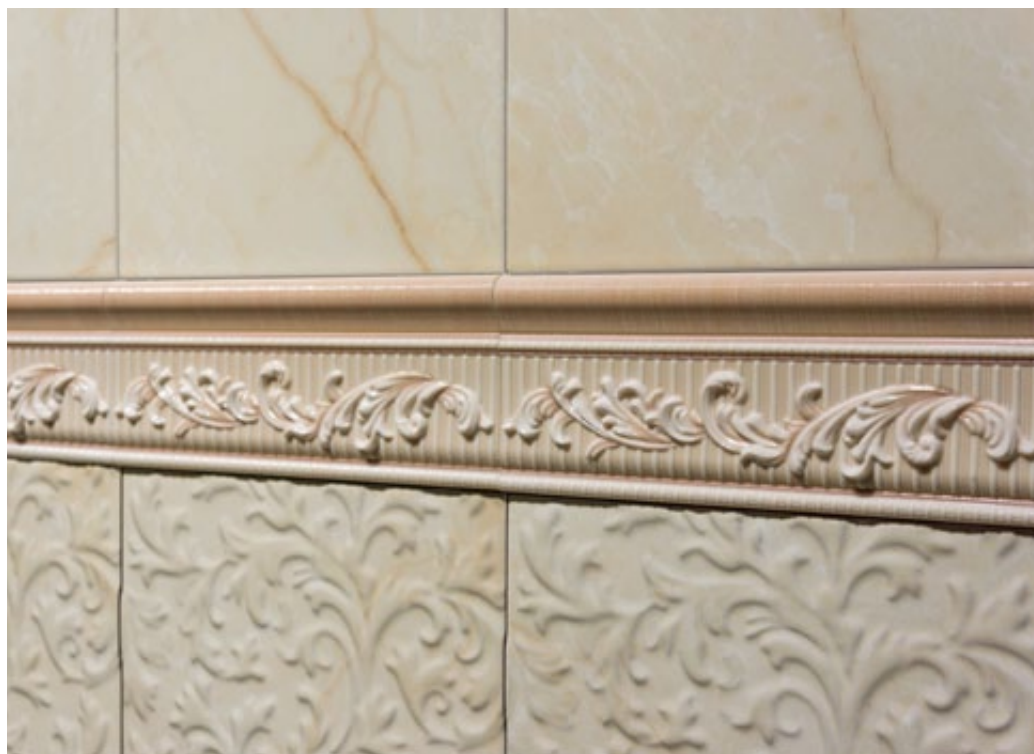
Lineage ivory - ivory epic 20x59,2 cm - Majestic cenefa