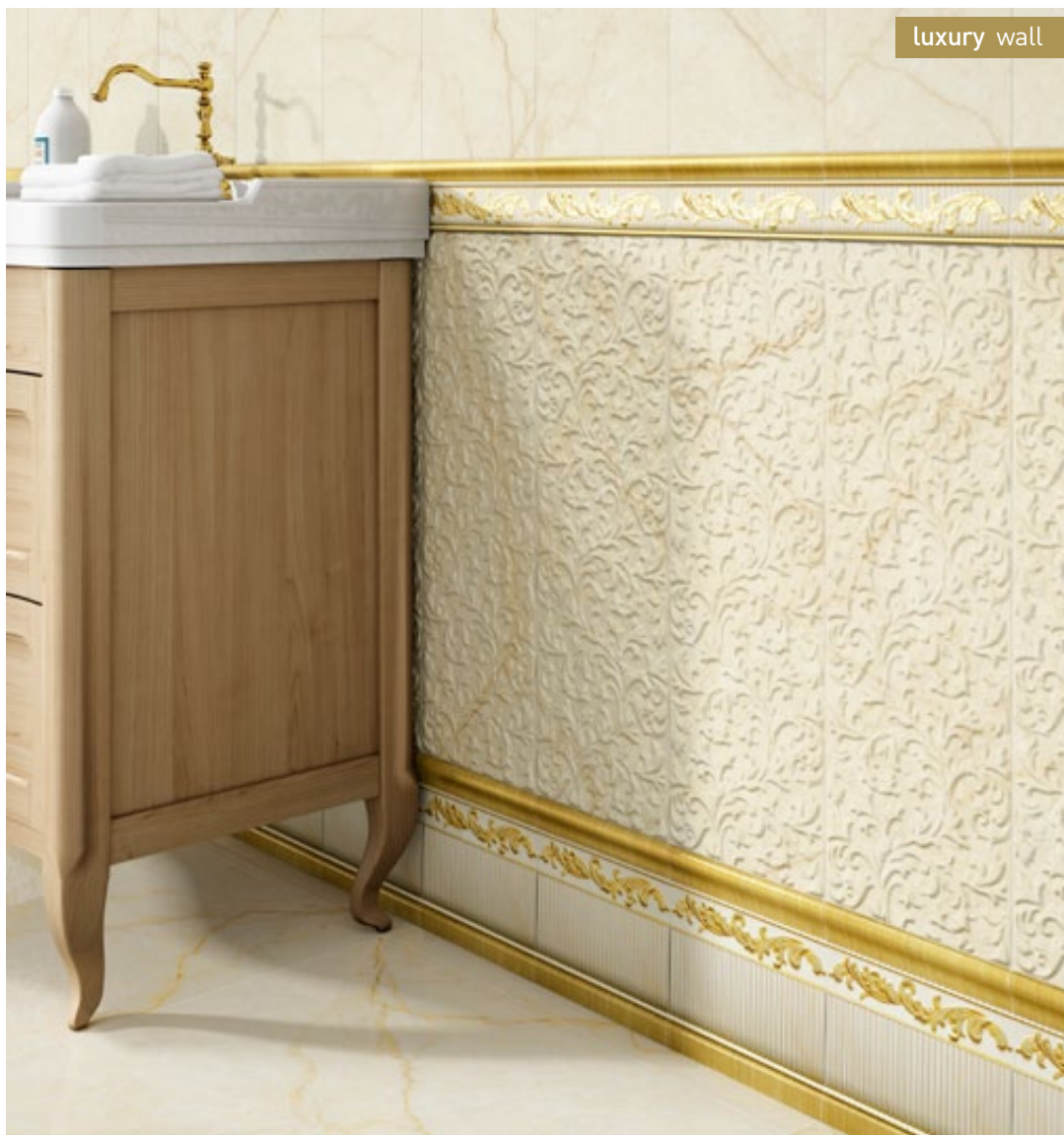
wall: Lineage ivory - ivory epic 20x59,2 cm- Majestic lista - cf-zocalo floor: Sagesta Bianco Pulido 59,55x59,55 cm