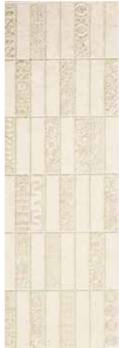
Adobe Ivory Runes 29,75 x 89,46 cm G-3258