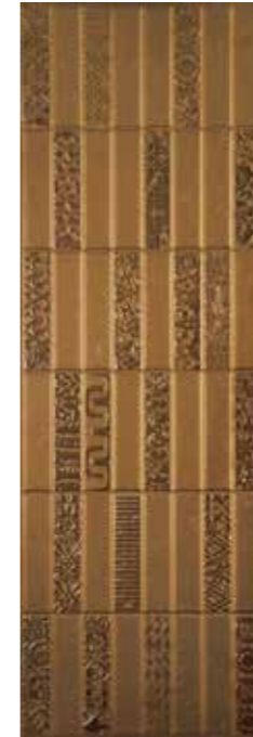
Adobe Gold 29,75 x 89,46 cm G-2465