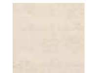
Adobe Ivory Natural 44,63 x 44,63 cm G-3218