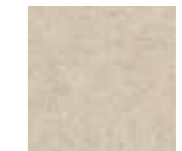
Adobe Beige Natural 44,63 x 44,63 cm G-3218

See adobe floor tiles on page 102. Ver colección adobe pavimento en página 102.