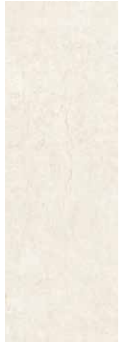
Adobe Ivory 29,75 x 89,46 cm G-3230