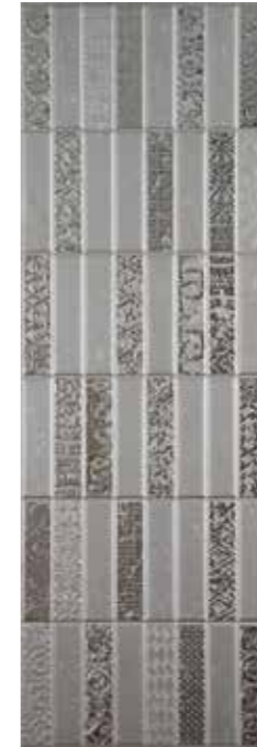
Adobe Silver 29,75 x 89,46 cm G-2465