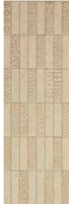
Adobe Beige Runes 29,75 x 89,46 cm G-3258