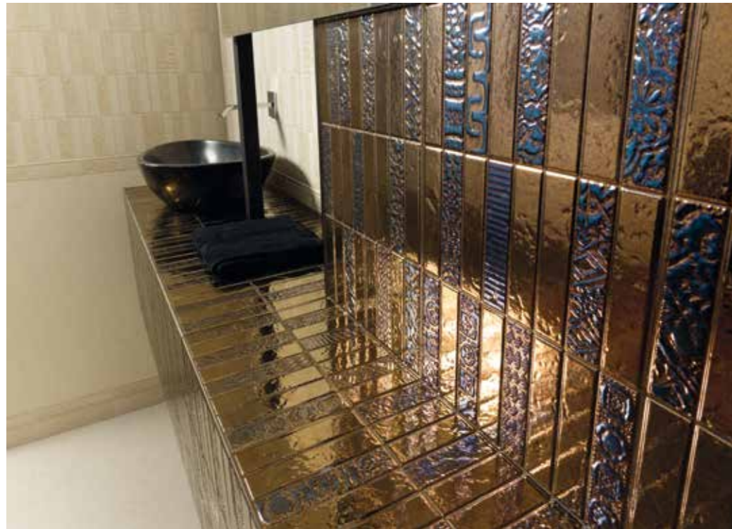
wall: Adobe ivory_ ivory runes_titanium 29,75x89,46 cm / Midas ivory Cf - Zocalo floor: Abode ivory natural 44,63x44,63 cm