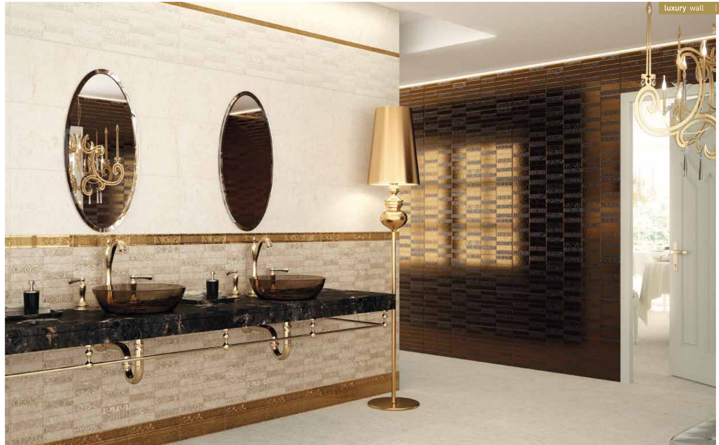
wall: Adobe ivory_ ivory runes_beige runes_titanium 29,75x89,46 cm / Midas Gold Mold- Cf - Zocalo floor: Abode beige natural 44,63x44,63 cm