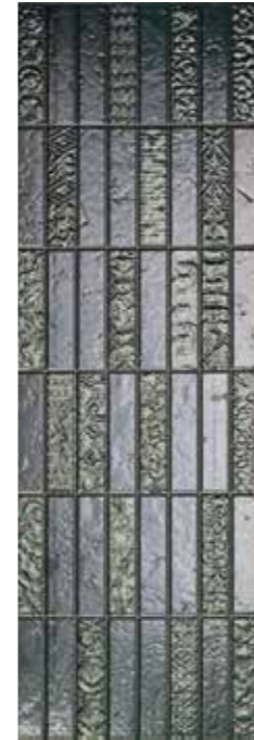
Adobe Cobalto Runes 29,75 x 89,46 cm G-3298