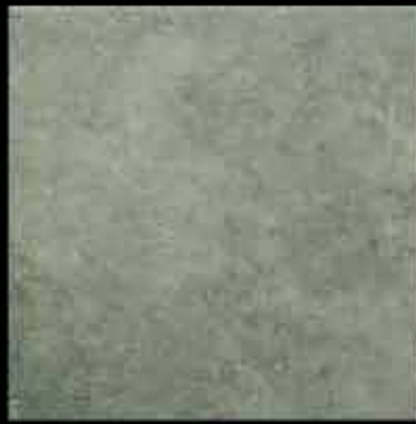
laguna 50x50 ~ 20"x20" 41469