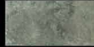
laguna 20x40 ~ 8"x16" 41111