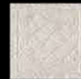
opale BR 1-4 20x20 ~ 8"x8" 41272