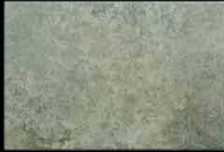
laguna 40x60 ~ 16"x24" 41143