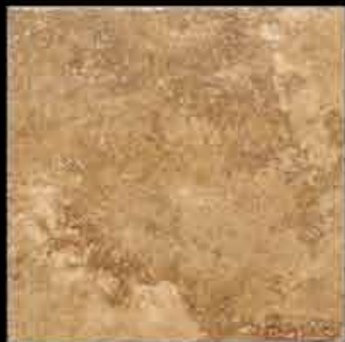
ocra 50x50 ~ 20"x20" 41471