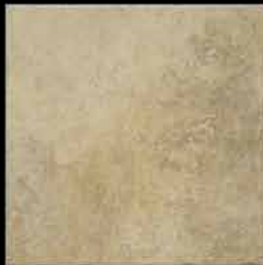
saturnia 50x50 ~ 20"x20" 41474