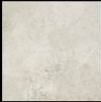
opale 50x50 ~ 20"x20" 41472