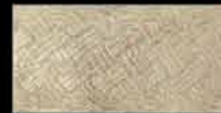
saturnia BR 1 20x40 ~ 8"x16" 41140