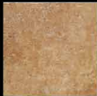
ocra 40x40 ~ 16"x16" 40891