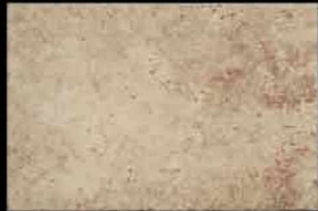
noce 40x60 ~ 16"x24" 40766