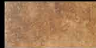
ocra 20x40 ~ 8"x16" 41112