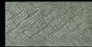
laguna BR 1 20x40 ~ 8"x16" 41136