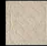
bianco BR 1-4 20x20 ~ 8"x8" 41120