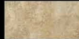
saturnia 20x40 ~ 8"x16" 40774