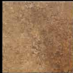
ruggine 40x40 ~ 16"x16" 40715