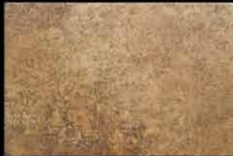
ruggine 40x60 ~ 16"x24" 40767