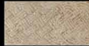
noce BR 1 20x40 ~ 8"x16" 41137