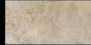
bianco 20x40 ~ 8"x16" 40770