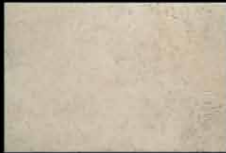
bianco 40x60 ~ 16"x24" 40765