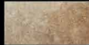
noce 20x40 ~ 8"x16" 40772