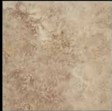
noce 50x50 ~ 20"x20" 41470