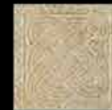
saturnia BR 1-4 20x20 ~ 8"x8" 41156