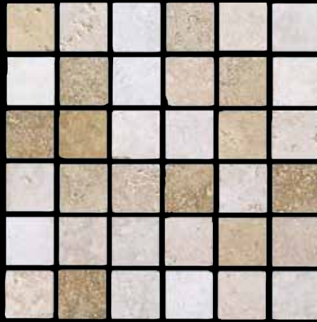
mosaico mix chiaro 30x30 ~ 12"x12" 41400 (tasselli 4,7x4,7 nei colori: opale, bianco, saturnia)