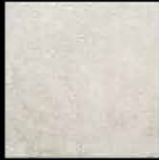
opale 40x40 ~ 16"x16" 41297