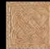
ocra BR 1-4 20x20 ~ 8"x8" 41123