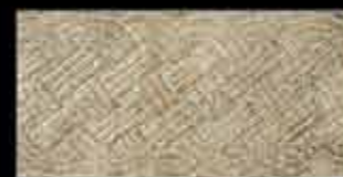
beige BR 1 20x40 ~ 8"x16" 41134