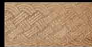
ocra BR 1 20x40 ~ 8"x16" 41138