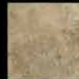
beige 20x20 8"x8" 41113