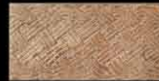
ruggine BR 1 20x40 ~ 8"x16" 41139