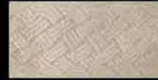
bianco BR 1 20x40 ~ 8"x16" 41135