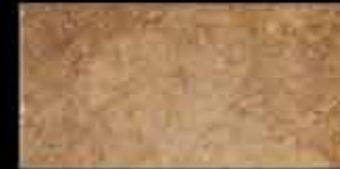
ruggine 20x40 ~ 8"x16" 40773