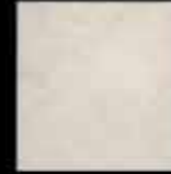
opale 20x20 8"x8" 41268