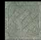
laguna BR 1-4 20x20 ~ 8"x8" 41121