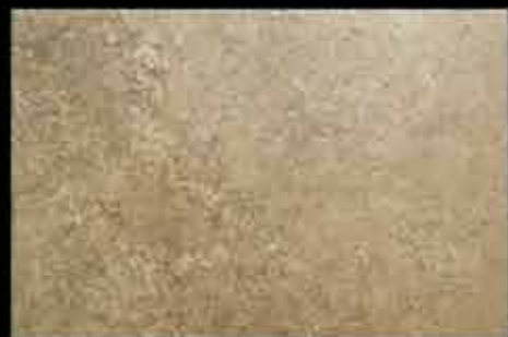
beige 40x60 ~ 16"x24" 41142