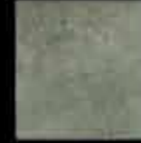
laguna 20x20 8"x8" 41114