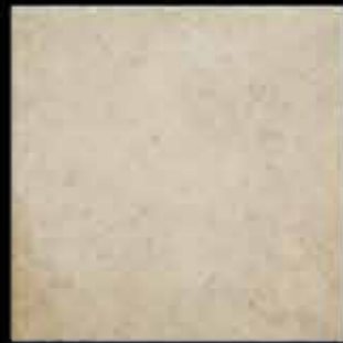
bianco 40x40 ~ 16"x16" 40713