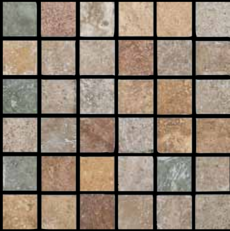
mosaico mix scuro 30x30 ~ 12"x12" 41401 (tasselli 4,7x4,7 nei colori: laguna, ruggine, beige, noce, ocra)