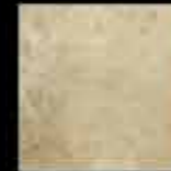
saturnia 20x20 8"x8" 40778