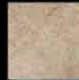
noce 20x20 8"x8" 40776