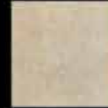
bianco 20x20 8"x8" 40775