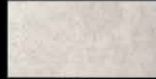
opale 20x40 ~ 8"x16" 41269