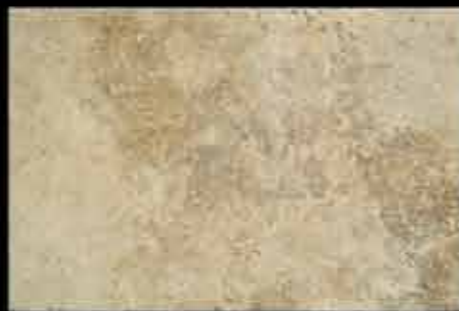
saturnia 40x60 ~ 16"x24" 40768