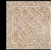
noce BR 1-4 20x20 ~ 8"x8" 41122