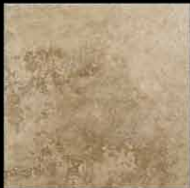
beige 50x50 ~ 20"x20" 41467