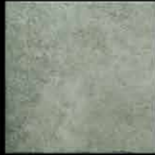
laguna 40x40 ~ 16"x16" 40890