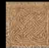
ruggine BR 1-4 20x20 ~ 8"x8" 41124