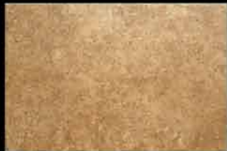
ocra 40x60 ~ 16"x24" 41144