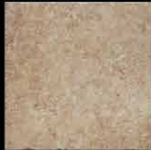
noce 40x40 ~ 16"x16" 40714