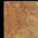
ocra 20x20 8"x8" 41115