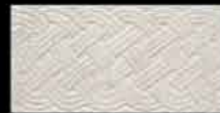
opale BR 1 20x40 ~ 8"x16" 41270