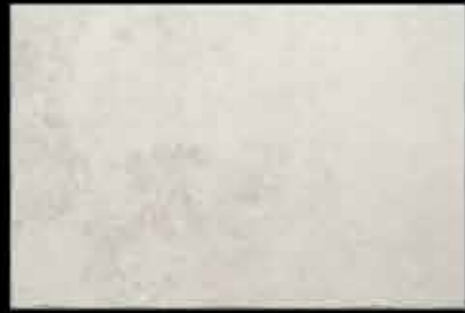
opale 40x60 ~ 16"x24" 41296