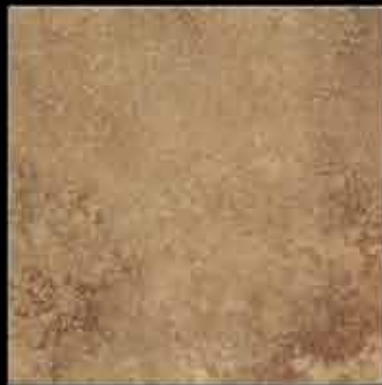
ruggine 50x50 ~ 20"x20" 41473