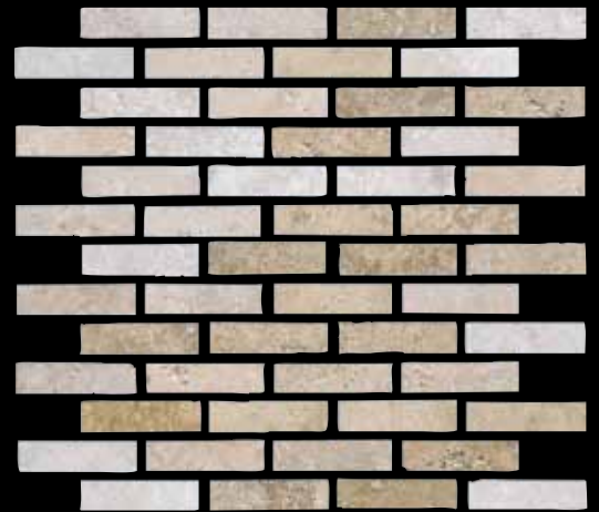
mosaico mix chiaro 30x30 ~ 12"x12" 41402 (tasselli 2x7,2 nei colori: opale, bianco, saturnia)