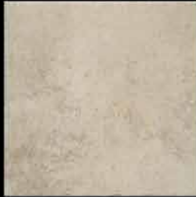
bianco 50x50 ~ 20"x20" 41468