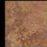
ruggine 20x20 8"x8" 40778