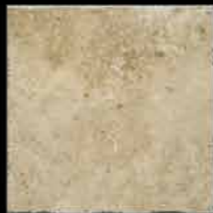
saturnia 40x40 ~ 16"x16" 40716