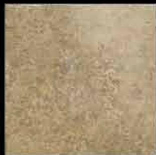
beige 40x40 ~ 16"x16" 40879