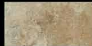
beige 20x40 ~ 8"x16" 41110