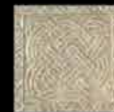
beige BR 1-4 20x20 ~ 8"x8" 41119